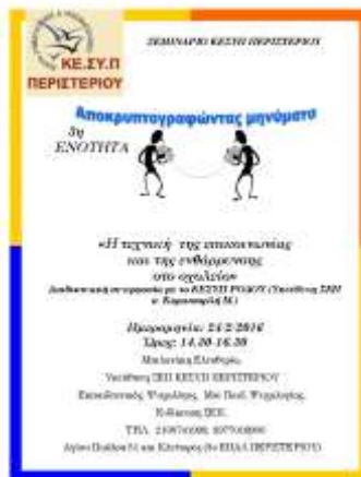
ΤΕΧΝΙΚΕΣ ΕΠΙΚΟΙΝΩΝΙΑΣ: 24-2-2016