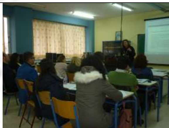
Εικόνα 1. ΣΥΝΕΡΓΑΣΙΑ ΜΕ ΤΟ ΚΕΝΤΡΟ ΠΡΟΛΗΨΗΣ ΟΔΟΙΠΟΡΙΚΟ Κ. ΠΕΛΕΚΑΝΑΚΗ 10-2-16