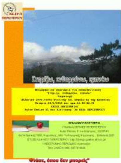
ΚΑΤΑΝΟΩΝΤΑΣ ΤΗ ΜΕΤΑΒΑΣΗ: 20-1-2016

Βιομηματικό επιμορφωτικό σεμινάριο για εκπαιδευτικούς την Τετάρτη:14/10/2015 και ώρα 12.30-14.30 με θέμα: " Οικοσυστημική προσέγγιση – δύσκολες συμπεριφορές στο σχολείο και ΣΕΠ