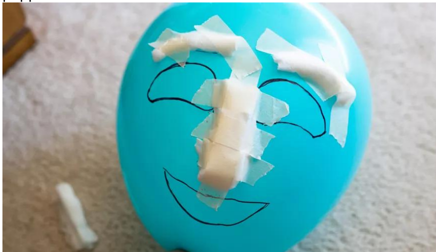
(Εικόνα για τα βήματα 1,2 και 3)

Βήμα τρίτο: Κολλάμε στην περιοχή των φρυδιών με την κολλητική ταινία το βαμβάκι.