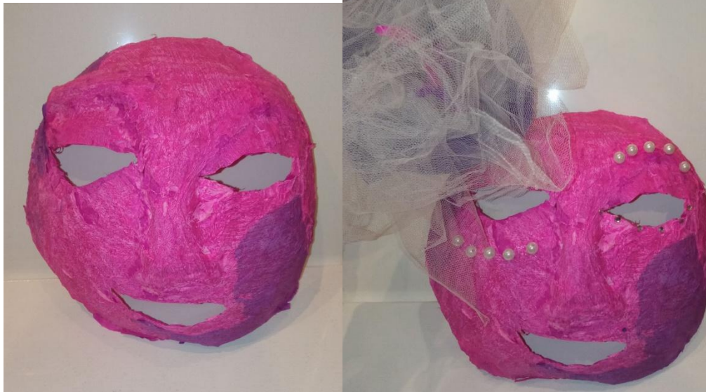
(Καλούπι από χρωματιστό γκοφρέ χαρτί και διακοσμημένη μάσκα, από τη μαθήτριά του τμήματος Α'3 Ηλιοπούλου Πηνελόπη)