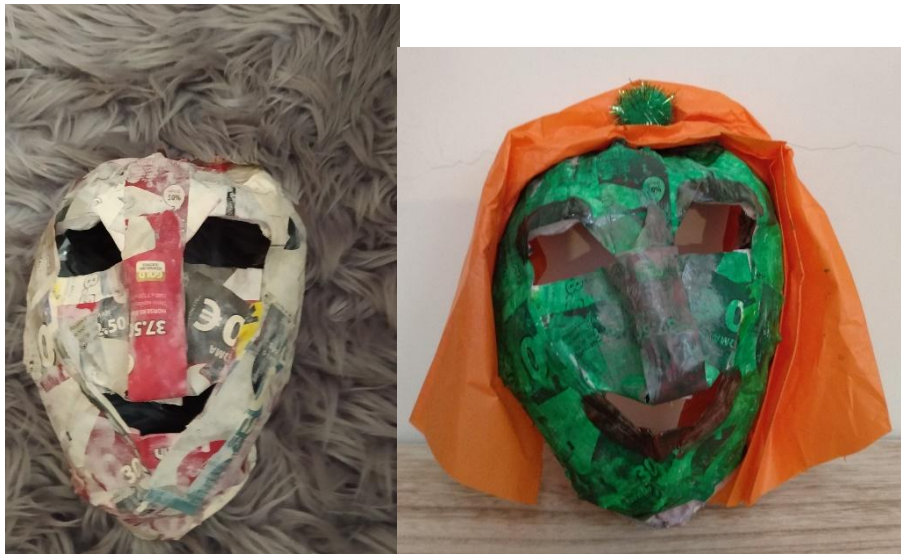
(Καλούπι από εφημεριδόχαρτο και διακοσμημένη μάσκα, από το μαθητή του τμήματος Α'2 Νίκο Λεντή)