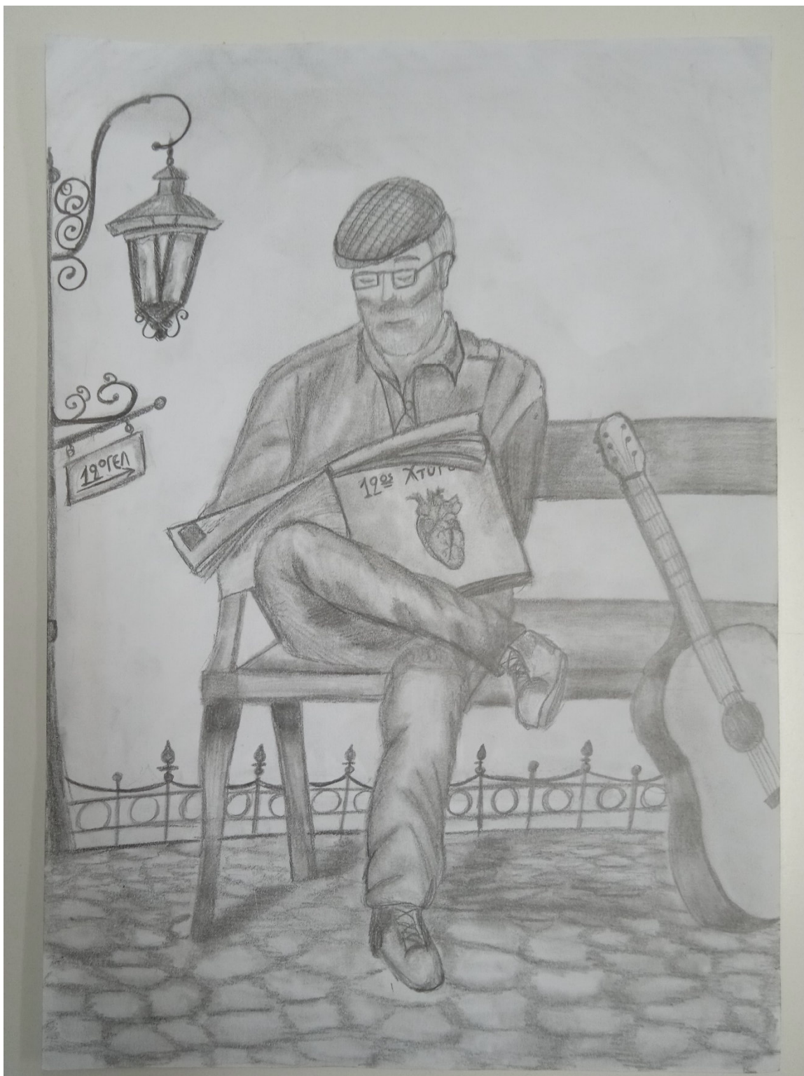
Το σκίτσο φιλοτέχνησε η Κυριακή Γρηγοριάδου

Σήμερα αρχίζει η κυκλοφορία της 1 ης ηλεκτρονικής εφημερίδας του 12 ου ΓΕΛ Θεσσαλονίκης. Πρόκειται για μια μαθητική προσπάθεια ενημέρωσης για τις σχολικές δραστηριότητες του Λυκείου μας, αλλά και δημοσιοποίησης ποικίλων θεμάτων που ενδιαφέρουν τους νέους και τις νέες, και όχι μόνο. Η συντακτική ομάδα γι' αυτό το τεύχος αποτελείται από τους μαθητές και μαθήτριες: