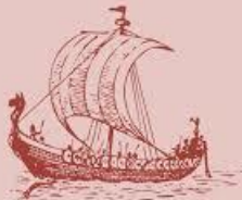
Ο Θεμιστοκλής και η ναυμαχία της Σαλαμίνας

Ο Θεμιστοκλής πιθανολογείται ότι γεννήθηκε το 527 π.Χ. στους Φρεαρρίους Αττικής (η σημερινή Φέριζα κοντά στην Ανάβυσσο). Ο πατέρας του ονομαζόταν Νεοκλής. Η ταυτότητα της μητέρας του είναι πιο