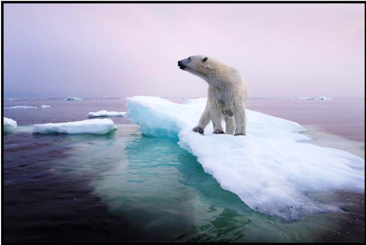
PHOTOGRAPHY 2: Keith Ladzinski

Στη συνέχεια επεξεργαστήκαμε τη φωτογραφία του Keith Ladzinski με τη μέθοδο Perkins. Τέθηκαν τα ίδια ερωτήματα αλλά ο χρόνος ήταν ταχύτερος για τις απαντήσεις καθώς ήδη ήξεραν τι θα επακολουθούσε.