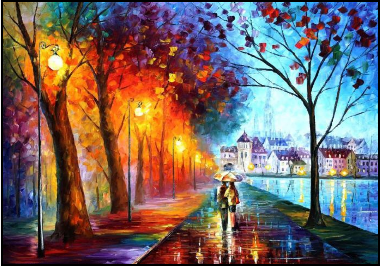
«City by the Lake» Leonid Afremov