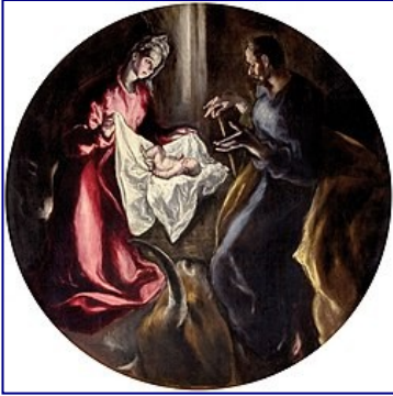
Η Γέννηση του Ιησού Δομήνικος Θεοτοκόπουλος

γιορτή της γέννησης του Ιησού Χριστού. Είναι μια από τις πιο διάσημες και αγαπημένες γιορτές σε πολλά μέρη