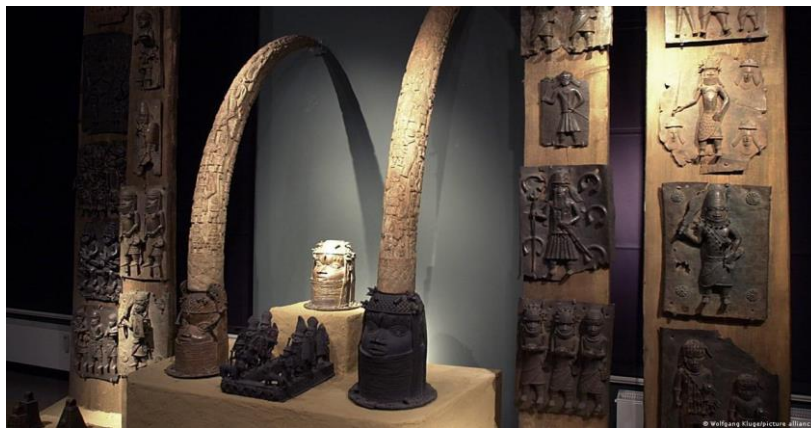
Εικόνα 13 Μέρος της συλλογής του Μουσείου της Λειψίας.

Φυσικά δεν είναι μόνο το βρετανικό μουσείο, του οποίου μέρος της συλλογής έχει αμφιλεγόμενο νομικό χαρακτήρα. Άλλα παραδείγματα είναι και το μουσείο αιγυπτιολογίας του Βερολίνου, όπου βρίσκεται η προτομή της Νεφερτίτης. Ο Ζάχι Χάουας, Γενικός Γραμματέας Αρχαιοτήτων της Αιγύπτου, υποστηρίζει ότι η προτομή πέρασε τότε (το 1912) από τους ελέγχους των αιγυπτιακών αρχών ως εύρημα «δεύτερης ποιότητας», γιατί οι ενδιαφερόμενοι την είχαν προηγουμένως μουτζουρώσει με λάσπη και μιλά για «ουσιαστική φυγάδευση του ευρήματος». [18] Είναι επίσης και το μουσείο εθνολογίας της Λειψίας και το Quai Branly μουσείο στο Παρίσι, τα οποία είναι ανάμεσα στα ιδρύματα, που έχουν μπρούτζα από το Μπενίν. [10.3] Πρέπει να αναφερθεί ότι τον Ιούλιο του 2022 η Γερμανία αποφάσισε να επιστρέψει τα αντικείμενα που βρίσκονται στα μουσεία της. [19][20]