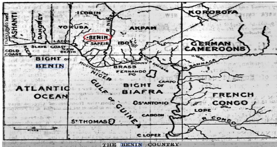
Εικόνα 5 Χάρτης της εποχής που δείχνει την δυτική Αφρική. Κυκλωμένο με κόκκινο το Μπενίν. 27 Φεβρουαρίου 1987.