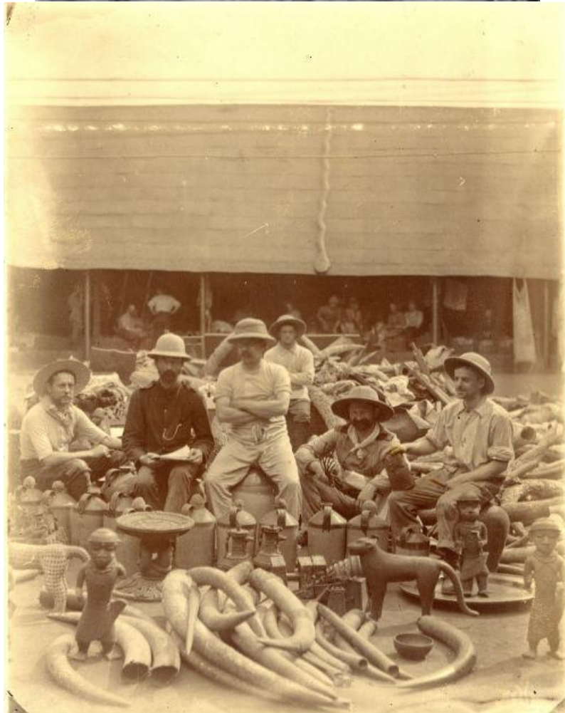
Εικόνα 8,9,10 Στρατιώτες μετά την εισβολή στο Μπενίν. Μπροστά τους διακρίνονται τα λάφυρά τους.

Αυτά τα αντικείμενα δεν ήταν μόνο σημαντικά, λόγω της υλικής τους αξίας. Σύμφωνα με τον πρίγκιπα Edun Akenzua, μέλος της βασιλικής οικογένειας του Μπενίν,: «Αυτά τα αντικείμενα είναι τα ημερολόγιά μας. Ότι ήταν σημαντικό, οι Oba (οι βασιλιάδες), Θα έλεγαν στους μεταλλουργούς να το σκαλίσουν σε μπρούτζο. Για να το καταγράψουν. Οπότε το να τα πάρουν μακριά, ήταν σαν να σκίσουν σελίδες από την ιστορία μας.» [11] , μια άποψη που συμμερίζεται και ο καθηγητής Chika Okeke-Agulu: «Ήταν οπτικά αρχεία του βασιλείου σε μια κοινωνία, που δεν ανέπτυξε το γραπτό λόγο, όπως τον γνωρίζουμε. Έλεγαν την ιστορία τους, αφηγούνταν τις ιστορίες των βασιλέων του βασιλείου. Την πολιτική και κοινωνική του ζωή.» [10.1]