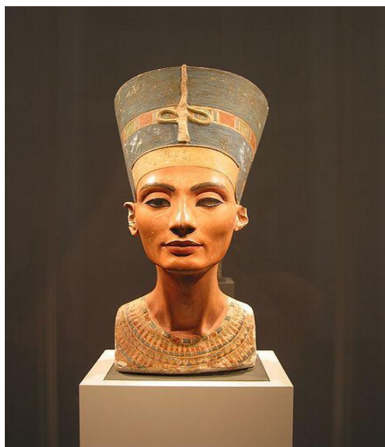
Εικόνα 14 Η προτομή της Νεφερτίτης στο Μουσείο του Βερολίνου.