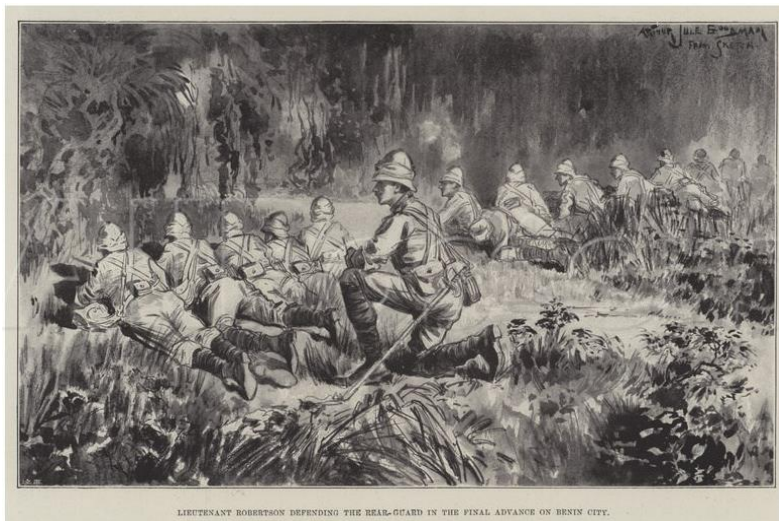
LIEUTENANT ROBERTSON DEFENDING THE REAR-GUARD IN THE FINAL ADVANCE ON BENIN CITY.

Αυτά τα καλλιτεχνήματα έφτασαν στο βρετανικό μουσείο το 1897, όταν η Βρετανική αυτοκρατορία εισέβαλλε και κατέκτησε το βασίλειο του Μπενίν. [8] Με αφορμή την δολοφονία 7 βρετανών εμπόρων και αξιωματούχων, έπειτα από εμπορικές διαμάχες (Η καταστροφή του Μπενίν στις 15 Ιανουαρίου 1897), μια ομάδα 1.200 βρετανών στρατιωτών ξεκίνησαν μια επιχείρηση, που θα γινόταν αργότερα γνωστή ως η τιμωριτική εκστρατεία του Μπενίν. Κατά την διάρκειά της, οι Βρετανοί κατέκτησαν την πόλη του Μπενίν και την έκαψαν ολοσχερώς. Όμως πριν το κάνουν αυτό μάζεψαν ότι πολύτιμο μπορούσαν να βρουν. [12] [14] Σύμφωνα με τον καθηγητή Chika Okeke-Agulu, ιστορικός τέχνης από την Νιγηρία, που διδάσκει στο πανεπιστήμιο του Princeton: «Υπήρχαν αναφορές για αυτούς τους ατελείωτους θησαυρούς μέσα στο παλάτι του βασιλιά του Μπενίν. Οπότε εάν μπορούσαν να πάρουν μαζί τους αυτούς τους θησαυρούς, οι πωλήσεις από αυτούς θα μπορούσαν να αντισταθμίσουν τα έξοδα της εισβολής. Αυτό ήταν καλά σχεδιασμένο. Άρα η τιμωριτική εκστρατεία ήταν με άλλα λόγια και μια οικονομική επιχείρηση.» Μάλιστα αυτά τα αντικείμενα τα άπλωσαν και τα φωτογράφησαν, σημειώνοντάς τα έπειτα ως λάφυρα. [10.2]