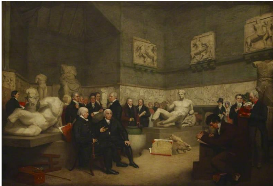
Εικόνα 4 Πίνακας που απεικονίζει τον λόρδο Έλγιν περιτριγυρισμένο από επισκέπτες στο Βρετανικό Μουσείο με τα ελγίνεια μάρμαρα.

Αγγλία. Όμως ο λόρδος Έλγιν αντιμετώπιζε οικονομικά προβλήματα, οπότε αποφάσισε να τα πουλήσει στο Βρετανικό μουσείο. Τελικά τα κατάφερε, πουλώντας τα για 35.000 λίρες, το οποίο όμως δεν ήταν ούτε το μισό ποσό που ξόδεψε για να τα μεταφέρει (74.000 λίρες). Τα αγάλματα μεταφέρθηκαν το 1832 στην θέση που βρίσκονται ακόμη και σήμερα. [5]