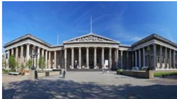
Εικόνα 3 Πρόσοψη του Βρετανικού Μουσείου.

Όταν λέμε τα μάρμαρα του Παρθενώνα, εννοούμε μια συλλογή από γλυπτά τα οποία εκτίθενται σήμερα στο Βρετανικό μουσείο και η προέλευσή τους είναι, όπως μπορεί κανείς να καταλάβει από το όνομα, ο Παρθενώνας. Όμως πως κατέληξαν αυτά τα μαρμάρια κομψοτεχνήματα σε ένα μουσείο στο Λονδίνο; Η απάντηση είναι πως κάποιος τα πήρε. Και ο τίτλος αυτού του κάποιου, προδίδεται από την άλλη ονομασία αυτών των αρχαιοτήτων: Τα Ελγίνεια μάρμαρα.