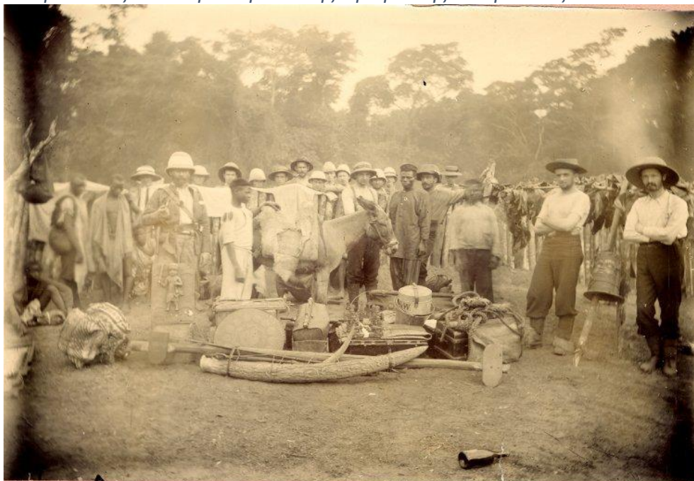
Εικόνα 7 Στρατιώτες κατά την διάρκεια της τιμωριτικής εκστρατείας ενάντια στο Μπενίν.