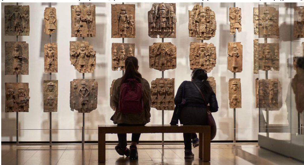
Εικόνα 12 Τα μπρούτζα του Μπενίν στο Βρετανικό Μουσείο.

Αυτά τα δημιουργήματα δεν πωλήθηκαν μόνο στο βρετανικό μουσείο, αλλά σήμερα βρίσκονται σε 161 ιδρύματα, μόνο 9 εκ των οποίων βρίσκονται στη Νιγηρία. [13]