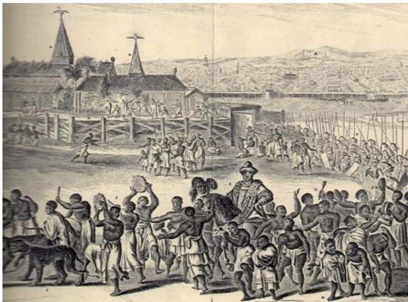
Εικόνα 6 Η πόλη του Μπενίν γύρω στο 1600.