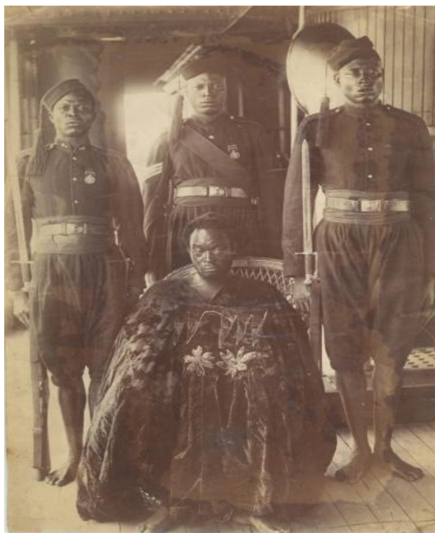
Εικόνα 11 Ο τότε βασιλιάς (Oba) του Μπενίν στο βρετανικό πλοίο, έπειτα από την εξόρισή του από τους Βρετανούς.

Αυτά τα δημιουργήματα δεν πωλήθηκαν μόνο στο βρετανικό μουσείο, αλλά σήμερα βρίσκονται σε 161 ιδρύματα, μόνο 9 εκ των οποίων βρίσκονται στη Νιγηρία. [13]