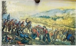
Η ΜΑΧΗ ΤΗΣ ΑΛΒΑΝΙΑΣ Ζωγραφική Αθανάσιου Ζωγράφου

η ζωγραφική στην από 847. που με από την α, άνδρες υδ, καθώς