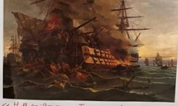
«Η Ηλλήνισσα του Νικητοζού», του Θεόδωρου Βαν Χανσεν