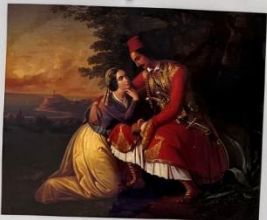
Ο έρωτας στα χρόνια της Επανάστασης