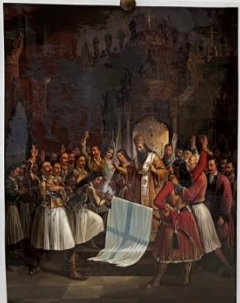
«Η ορκωμοσία των φιλοελλήνων» του Θεόδωρου Βρυζακί «Ο Παύλος Πατριώτς Γερμανός εισηγεί σε ελληνικά».