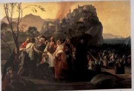
Francesco Hayez, Προσπεκτιβα στην Πάργα, 1831. Παναγιώτη Cívica Brescia.

Στην εικόνα αυτή περιγράφεται το θέαμα των κατοίκων της Πάργας που επέβλεπαν το θόρυβο της Προσπεκτιβας. Επέβλεπαν το θόρυβο της Προσπεκτιβας για να αποκρίθουν τις ακριβέστερες των Τούρκων και των Τουρκολόγων του Αλή Πασά.