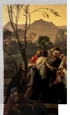
Francesco την Παύλα. Brescia. Στην εκδόνα δοξία των εστερέσαν σε για να ασε των Τούρκων του Αλή Πασά