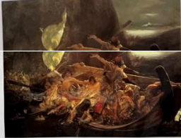
«Η Ηλλήνισσα του Νικητοζού», του Θεόδωρου Βαν Χανσεν

Η εικόνα απεικονίζει τον Ιωάννη Καποδίστρια, τον πρώτο κυβερνήτη της Ελλάδας. Το έργο είναι ηρωικό και εθνικό, δείχνει τον Ιωάννη Καποδίστρια, έναν από τους ηγέτες της Επανάστασης, να κάθεται στο γραφείο του. Ο πίνακας απεικονίζει τον Ιωάννη Καποδίστρια, τον πρώτο κυβερνήτη της Ελλάδας, να κάθεται στο γραφείο του. Ο πίνακας απεικονίζει τον Ιωάννη Καποδίστρια, τον πρώτο κυβερνήτη της Ελλάδας, να κάθεται στο γραφείο του.