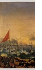
«Η Ναυμαχία Louis Adolphe Ναυτική μάχη του Γαβριήλ Δουβάρ συνταγματάρχη σε Βαλασσόγρια»