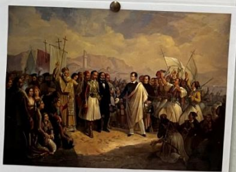
«Η υποδοχή του Λόρδου Βύρωνα στο Μεσολόγγι», του Θεόδωρου Βρυζακί