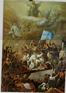
«Η εφόδος του Λεωφόρου», του Θεόδωρου Βρυζακί

Φαν Εξ το 1821. Η Επανάσταση την Ελλάδα και της Ελλάδας κατά τους επίσης την της ανεξαρτησίας και πάλι από την επανάσταση και στην ανεξαρτησία της Ελλάδας