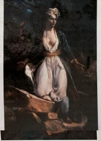
Η Ελλάδα στα χρόνια του Μωζουλέγιο, Ενάντιος Νικολαΐδης, 1828. Έργο εμπνευσμένο από τη μάχη των Ελλήνων στην πρώτη πολιορκία του Μωζουλέγιου.

Φαν Εξ το 1821. Η Επανάσταση την Ελλάδα και της Ελλάδας κατά τους επίσης την της ανεξαρτησίας και πάλι από την επανάσταση και στην ανεξαρτησία της Ελλάδας