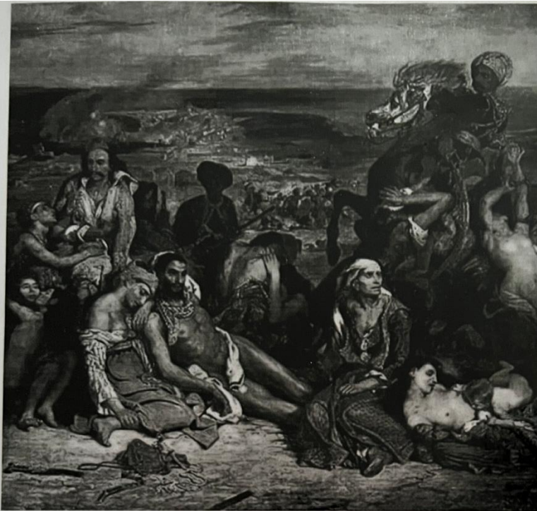
Ε. Ντελακρουά, Η σφαγή της Χίου

Ο πίνακας αυτός καθήλωσε τους δρόμους του Παρισιού και κινητοποίησε σημαντικά την ευρωπαϊκή γνώμη υπέρ του αγώνα των Ελλήνων κατά της υποδούλωσης. Μάλιστα, ο Ντελακρουά δεν παρουσιάζει στα έργα του απλώς τη σύγκρουση μεταξύ δυο λαών, αλλά συναισθήματα, όπως φαίνεται στο πίνακά του για την έξοδο του Μεσολογγίου, όπου η Ελλάδα συμβολίζεται με μια νέα γυναίκα, η οποία ορθώνεται πάνω από τα ερείπια του Μεσολογγίου, σηκώνοντας τα χέρια της, για να καλέσει βοήθεια.