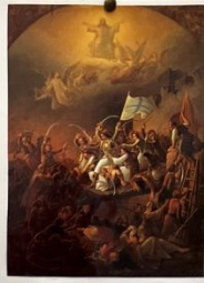
«Η Ηλλήνισσα του Νικητοζού», του Θεόδωρου Βαν Χανσεν