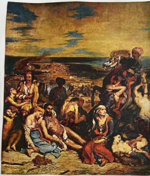
Ευγένιος Ντελακρουά, Η σφαγή της Χίου, Παρίσι, Μουσείο Λούβρου

Η Σφαγή της Χίου είναι πίνακας ζωγραφικής του Γάλλου ζωγράφου Ευγένιου Ντελακρουά, εμπνευσμένος από την σφαγή της Χίου το 1822. Η σφαγή δεκάδων χιλιάδων Ελλήνων της Χίου από τον οθωμανικό στρατό συνέβη κατά το δεύτερο έτος της Ελληνικής Επανάστασης.