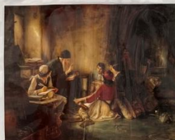
Νικόλαος Πισσις, Ελληνικών Ιστοριών εν κωλύει Ελληνικά, γνωστότερο ως Το κρυφό σχολειό, Έδραση Αρντονώζ, 1805/06