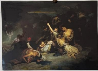
«Λυτρωμένες Γυναίκες» Ary Scheffer, 1827 Ary Scheffer (1795-1858), Γαλλο-Ολλανδός ρομαντικός ζωγράφος

η ζωγραφική στην από 847. που με από την α, άνδρες υδ, καθώς