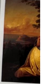
Ο έρωτας Επανάσταση