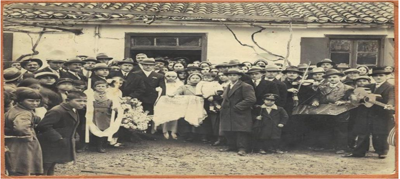
Παραδοσιακός γάμος στο Μαρκόπουλο στα Μεσόγεια τη δεκαετία του '30.

Η ελληνική κοινωνία τις τελευταίες δεκαετίες έχει αλλάξει ριζικά κάνοντας βήματα μπροστά, με καθοριστικές παρεμβάσεις της ελληνικής πολιτείας. Πόσοι θυμούνται ή πόσοι γνωρίζουν, ότι ως το 1983, ήταν θεσμοθετημένος ο θεσμός της προίκας; Ο απαρχαιωμένος αυτός θεσμός καταργήθηκε στις 18 Φεβρουαρίου του όχι και τόσο μακρινού 1983, με το Νόμο 1329/83, ο οποίος έχει χαρακτηριστεί τομή στα κοινωνικά πράγματα, επιφέροντας μια ουσιαστική ρήξη με το παρελθόν και είχε ως στόχο την ισότητα των δύο φύλων και των κοινωνικών στρωμάτων.