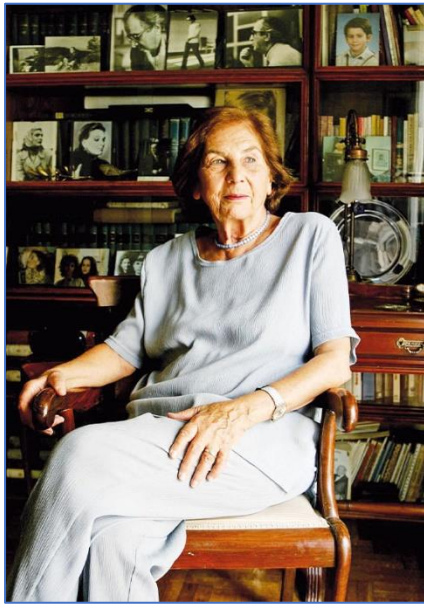
Άλκη Ζέη https://www.alkizei.com

Η Άλκη Ζέη γεννήθηκε το 1923 στην Αθήνα αλλά έζησε ως παιδί στη Σάμο, μαζί με τη μεγαλύτερή της αδελφή, όσον καιρό η μητέρα της ανάρρωνε από φυματίωση. Ο αδελφός της μητέρας της, παντρεύτηκε τη γνωστή συγγραφέα Διδώ Σωτηρίου, η οποία βοήθησε τη Ζέη να ασχοληθεί με τη συγγραφή.