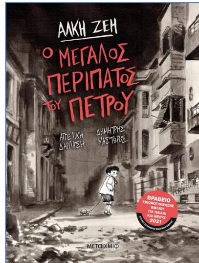
Ο μεγάλος περίπατος του Πέτρου https://www.alkizei.com

Η Άλκη Ζέη απεβίωσε στις 27 Φεβρουαρίου 2020, σε ηλικία 96 ετών.