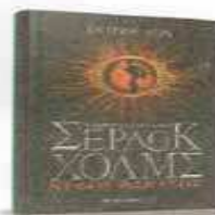
ΑΝΤΡΙΟΥ ΛΕΪΝ «ΟΙ ΠΕΡΙΠΕΤΕΙΕΣ ΤΟΥ ΝΕΑΡΟΥ ΣΕΡΛΟΚ ΧΟΛΜΣ. ΝΕΦΟΣ ΘΑΝΑΤΟΥ» ΕΚΔΟΣΕΙΣ ΜΕΤΑΙΩΜΩ 13,30€

Πρόκειται για το πρώτο μέρος μιας συναρπαστικής σειράς που για πρώτη φορά έρχεται να ρίξει φως στα εφηβικά χρόνια του διάσημου ντετέκτιβ. Πώς ήταν ως έφηβος; Πού πήγε σχολείο και ποιοι ήταν οι φίλοι του; Πού και πότε απέκτησε τις διάσημες ικανότητές του; Τι τον φόβιζε και ποια ήταν η πρώτη του αγάπη;