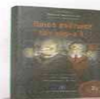
ΘΩΔΩΡΗΣ ΑΝΔΡΙΟΠΟΥΛΟΣ «ΠΟΙΟΣ ΣΚΟΤΩΣΕ ΤΟΝ ΚΥΡΙΟ Χ»

Πρόκειται για το πρώτο μέρος μιας συναρπαστικής σειράς που για πρώτη φορά έρχεται να ρίξει φως στα εφηβικά χρόνια του διάσημου ντετέκτιβ. Πώς ήταν ως έφηβος; Πού πήγε σχολείο και ποιοι ήταν οι φίλοι του; Πού και πότε απέκτησε τις διάσημες ικανότητές του; Τι τον φόβιζε και ποια ήταν η πρώτη του αγάπη;