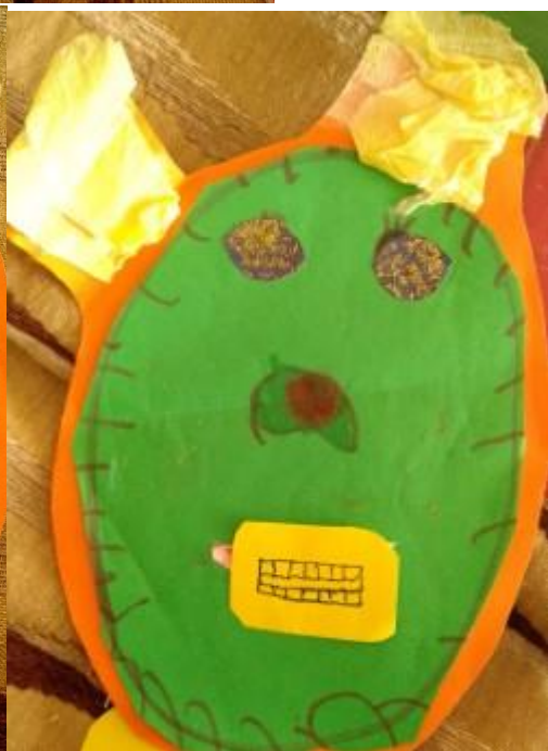
ΚΑΤΑΣΚΕΥΗ ΣΥΝΑΙΣΘΗΜΑΤΑ II