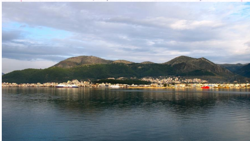
ΜΑΚΕΛΛΑ -ΑΝΤΩΝΗΣ -ΚΑΛΥΨΩ

Η Χουμένιτσα βρίσκεται στην Ήπειρο. Την επισκεφτήκαμε πριν από ένα χρόνο για μαζομαίρως διακοπές. Ήταν μαγευτικά... Μόλις μπείτε στην πόλη θα εντυπωσιαστείτε από την φυσική της ομορφιά και τα πέτρινα σπίτια με τις τεράστιες πέτρινες αυλές τους. Έχει Παραλίες στις οποίες μπορούν οι επισκέπτες να βουτήξουν να θαυμάσουν την υπέροχη θάλασσα. Έχει καταπράσινα δάση με μεγάλη βλάστηση. Το φθινόπωρο όλο το δάσος γίνεται πορτοκαλοκόκκινο. Τον χειμώνα πάλι έχει πολύ χιόνι και μπορούμε να παίξουμε χιμάρια. Την Άνοιξη όλα τα λουλούδια είναι ανοιχτά και τα δέντρα κουνούν τα καταπράσινα φύλλα τους στο αέρα. Το μαζομαίρι έχει και το ήλιο και μπορεί να φτάσει ως 40 βαθμούς αλλά μας δροσίζουν οι θάλασσες. Μου έκανε εντύπωση ότι τα σπίτια είναι αθήρια πέτρινα αλλά μαζομαίρως. Αισθάνομαι ότι έχω τόσο δυνατά συναισθήματα για τον τόπο αυτό που είναι απεριγραπτά. →