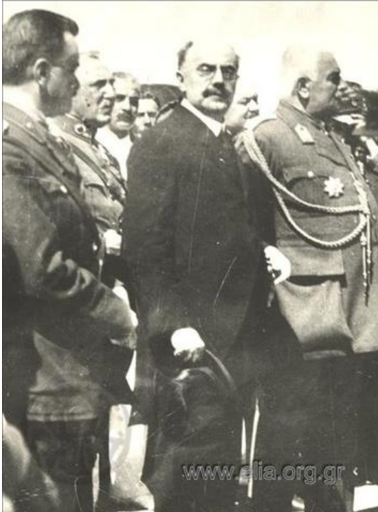
Ο Ύπατος Αρμοστής Σμύρνης Αριστείδης Στεργιάδης.

Στις 19 Αυγούστου, στάλθηκε στους αντιπροσώπους της Ύπατης Αρμοστείας, εμπιστευτικό μήνυμα στις πόλεις Αδραμύττιο, Πάνορμο, Αρτάκη, Μουδανιά, Κίο, Μπάλια, Σαλιχλί και Φιλαδέλφεια κ.α., με θέμα τη συγκέντρωση του αρχαιακού υλικού τους, λόγω αναχώρησής τους, χωρίς να αντιληφθεί κάτι ο πληθυσμός. Από κάποιους αντιπροσώπους ζητήθηκε να ενθαρρύνουν τον πληθυσμό της περιοχής να παραμείνει στα εδάφη τους. Επίσης, τη νύχτα της 21ης προς 22ας Αυγούστου 1922, σε τηλεγράφημά του ο Στεργιάδης προς τον υποδιοικητή των ελληνικών δυνάμεων της περιοχής Κασαμπά, του λέει: «Εμποδίσσατε αναχώρησιν πολιτών, καθ' ότι στρατός επ' ουδενί λόγο εγκαταλείψει περιφέρειάν σας» .