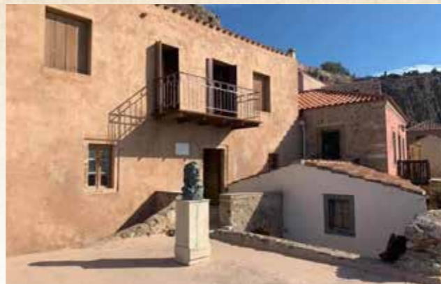
Το σπίτι του Γ. Ρίτσου στη Μονεμβασιά