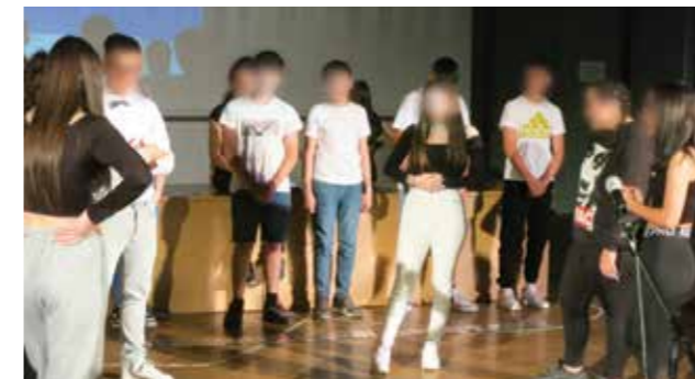
Παρουσίαση στην Aula, της Φιλοσοφικής Σχολής -Η ΠΙΟ ΤΡΕΛΗ ΣΥΝΑΝΤΗΣΗ- από το τμήμα Β2. Πλούσιο το χειροκρότημα!

Ένας θεματικός άξονας τεράστιας σημασίας που έθεσε φέτος το Πανεπιστήμιο, όχι μόνο για τις/τους έφηβες/ους, αλλά για όλους τους ανθρώπους. Τα παιδιά είναι έτοιμα να σας πάνε ένα ταξίδι στο υπόβαθρο της ψυχής και να σας δείξουν πώς μπορούν να συμβιώσουν έχοντας διαφορετικές ιδεοψυχαναγκαστικές διαταραχές και ψυχοσωματικά συμπτώματα!