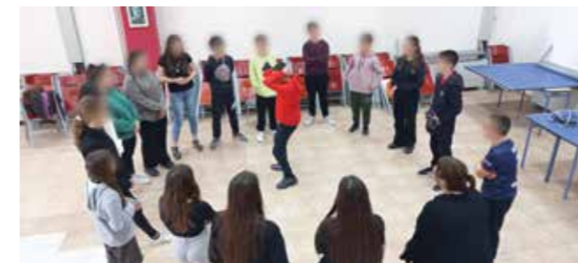
Θεατρικές ασκήσεις και παιχνίδια μας εξοικείωσαν με το θέατρο και έδεσαν την ομάδα