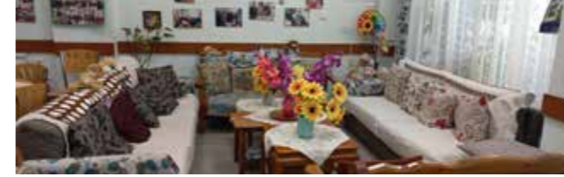
Ένα ΚΑΠΗ με ζωηρή διακώσμηση για τα ηλικιωμένα άτομα αλλά και για όποιον-όποια θέλει να τα συναντήσει!

Σε συνεργασία με το Εθνικό Θεματικό Δίκτυο Περιβαλλοντικής Εκπαίδευσης « Βιώσιμη Πόλη: η πόλη ως πεδίο εκπαίδευσης για την αειφορία » που συντονίζεται από το ΚΠΕ Ελευθερίου, Κορδελιού & Βερτίσκου.