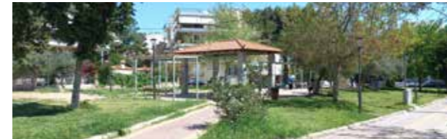
Χαρακτηριστικό της περιοχής ένα μακρύ γραμμικό πάρκο που δίνει ανάσα στις νεόχτιστες πολυκατοικίες που συνυπάρχουν με παλιές μονοκατοικίες και αυλές.