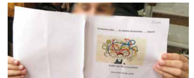
Πριν την παρουσίαση...