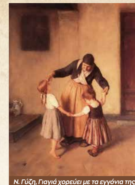
Ν. Γύζη, Γιαγιά χορεύει με τα εγγόνια της

μόνη μου στην κουζίνα για να φτιάξω τους πατροπαράδοτους λουκουμάδες, ώστε να νιώσω ότι δεν έχουν αλλάξει και τόσα πολλά μέσα στα τελευταία χρόνια. Μου φαίνεται ότι τελικά ίσως αυτές να είναι οι πραγματικές χαρές των γιορτών. Μικρές στιγμές της καθημερινότητας, οι οποίες με την πάροδο του χρόνου γίνονται οι δικές μας οικογενειακές παραδόσεις και αποκτούν μια ξεχωριστή θέση στην καρδιά μας.