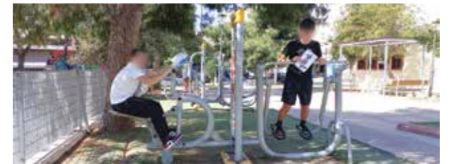
Βρήκαμε και όργανα γυμναστικής!