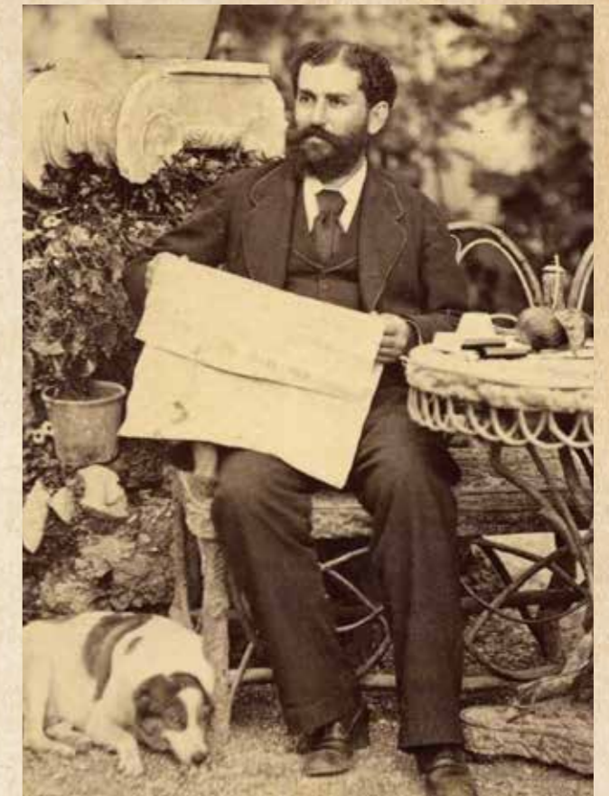
Εμμανουήλ Μπενάκης, πατέρας της Πηνελόπης Δέλτα

Στις αρχές του 1941 ο Δραγούμης, αν και νεκρός, «μπήκε» ξανά στη ζωή της. Ο αδελφός του, Φίλιππος, παρέδωσε στην Πηνελόπη τα προσωπικά του ημερολόγια και αρχεία. Εκείνη, αφού ξόδεψε αμέτρητες ώρες μελετώντας τα, πρόσθεσε άλλες χίλιες περίπου σελίδες σχολίων στο έργο του αγαπημένου της.