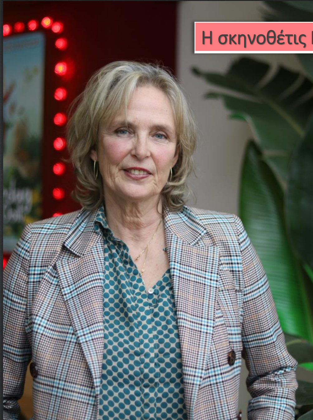
Η σκηνοθέτις Mijke de Jong