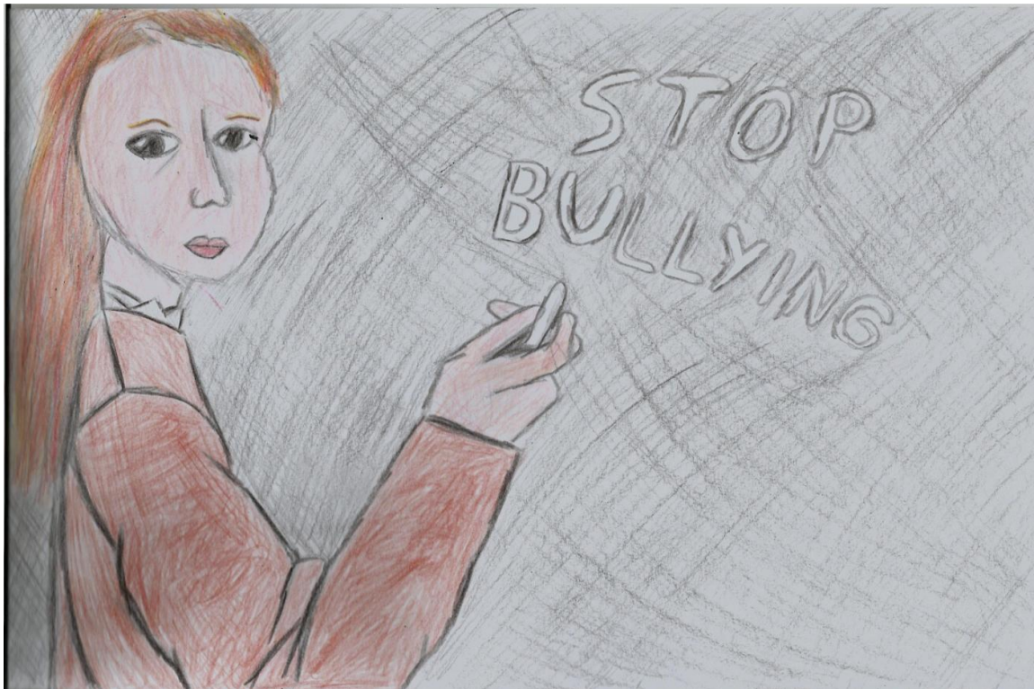
1 ο Γυμνάσιο Ελευθερίου – Κορδελιού e-ματιά του 1 ου