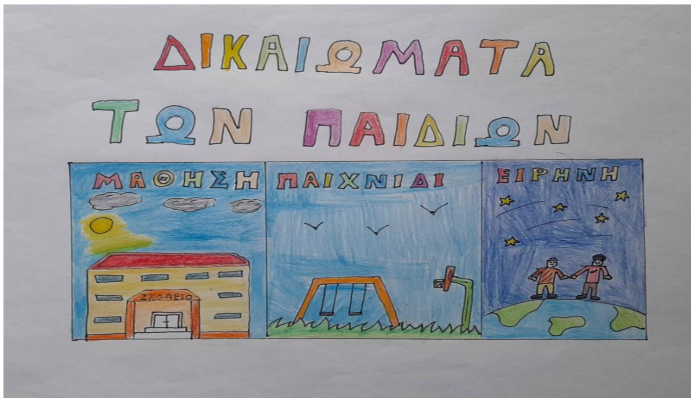
4ο Γυμνάσιο Κοζάνης – Ενός τετάρτου υπόθεση