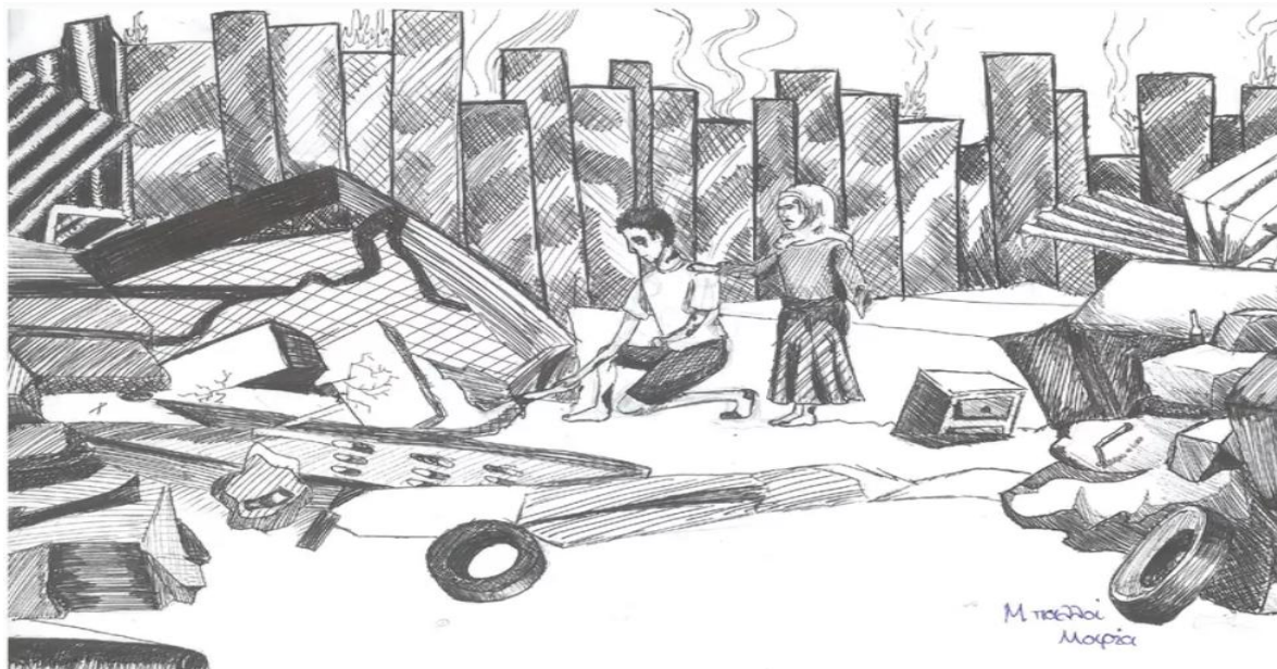
ΓΕΛ Χορτιάτη - Ο Γυάλινος Κόσμος