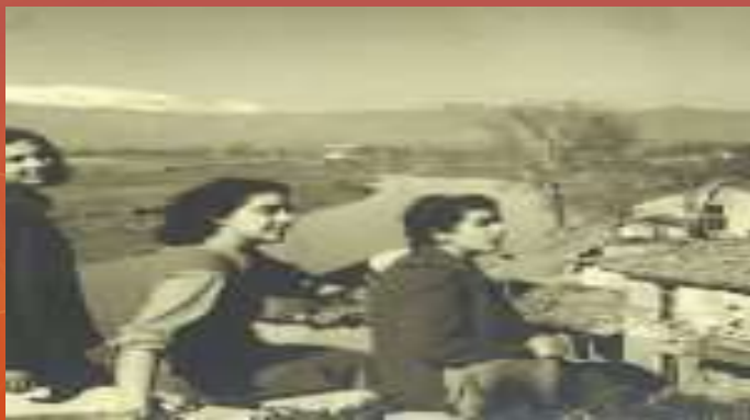
Λάρισα Δεκέμβρης '44