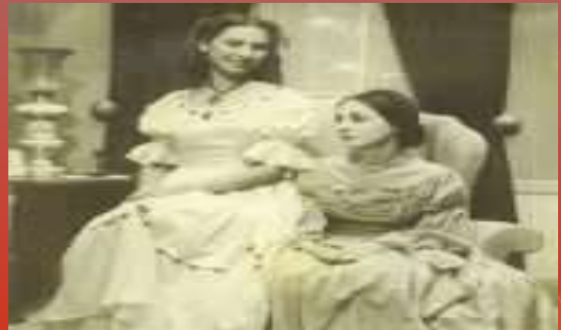
Με την Έλλη Λαμπέτη