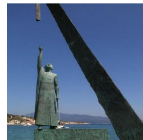
ΑΓΑΛΜΑ ΤΟΥ ΠΥΘΑΓΟΡΑ ΣΤΗΝ ΣΑΜΟ