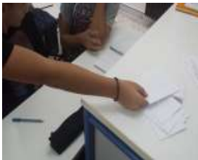
Δραστηριότητες του σχολείου μας σελ. 2,3,10