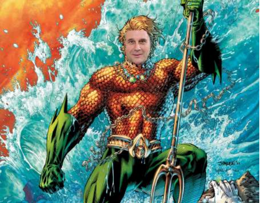
Ο κ. Πιλάτος θα αναδείξει μέσω πολυάριθμων ταινιών που θα γυρίσει την σφραγίδα του Θεού επι της γης.