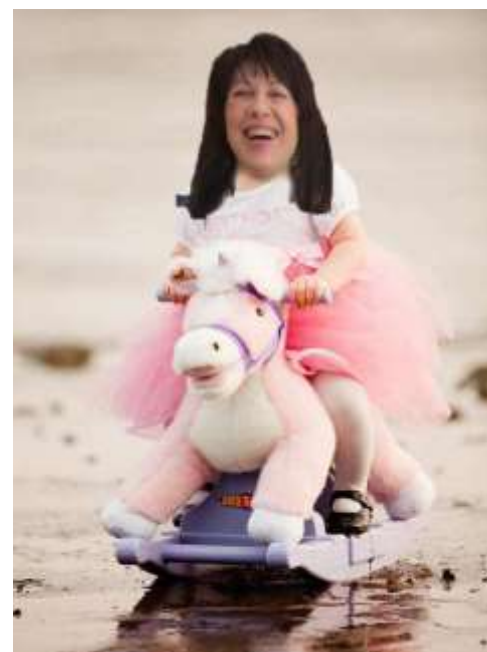
Η κ. Κανελλοπούλου όλο το καλοκαίρι θα το περάσει κλεισμένη στις βιβλιοθήκες