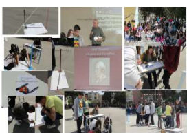
Δραστηριότητες του σχολείου μας σελ.