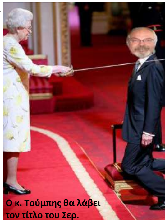
Ο κ. Τούμπης θα λάβει τον τίτλο του Σερ.