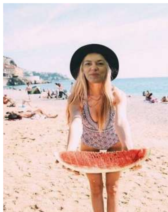
Η κ. Παναγιώτου θα διορθώνει γραπτά όλο το καλοκαίρι .