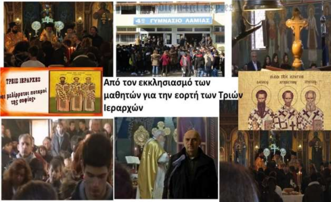
Από τον εκκλησιασμό των μαθητών για την εορτή των Τριών Ιεραρχών

Συνεχίζονται οι μικροπαρεμβάσεις στο σχολείο μας Συνεχίζονται με αμείωτο ρυθμό οι παρεμβάσεις στο χώρο του σχολείου μας.