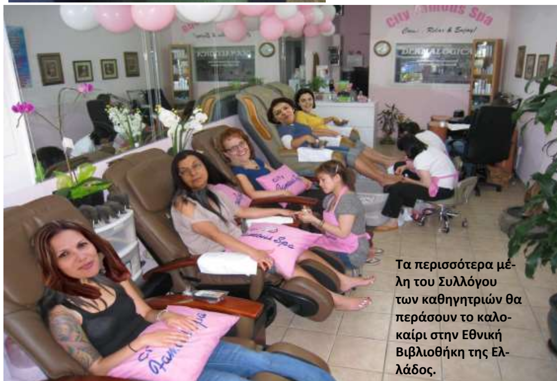
Τα περισσότερα μέλη του Συλλόγου των καθηγητριών θα περάσουν το καλοκαίρι στην Εθνική Βιβλιοθήκη της Ελλάδος.