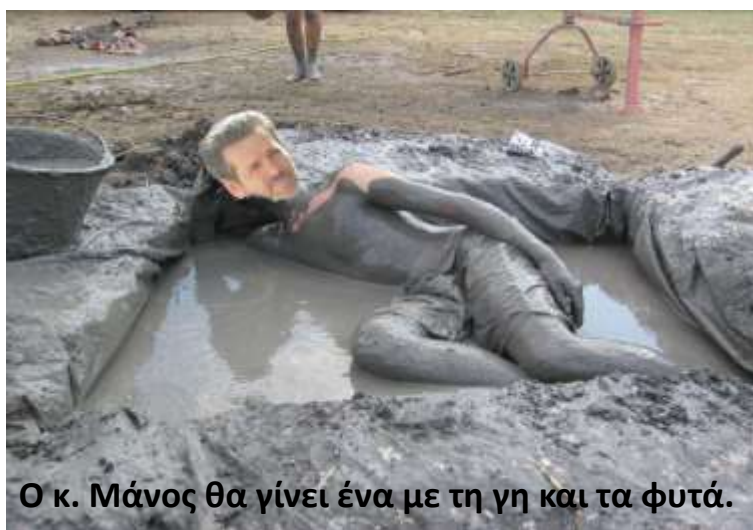
Ο κ. Μάνος θα γίνει ένα με τη γη και τα φυτά.