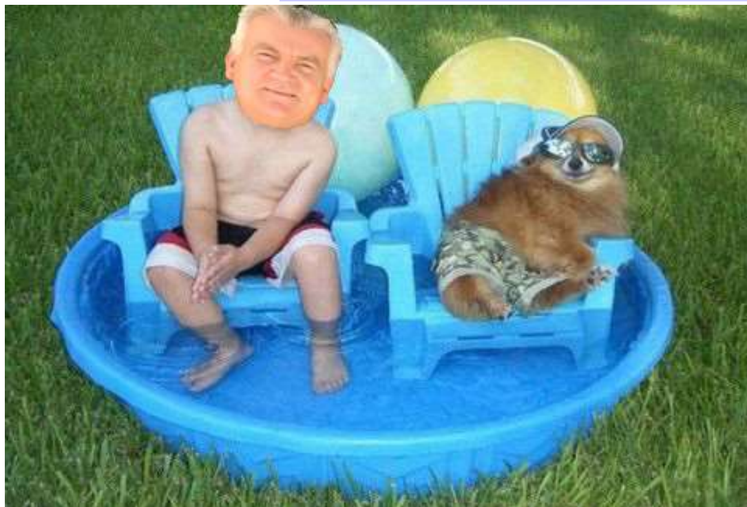
Ο κ. Κοτρογιάννης θα κάνει τα μπάνια του στην ιδιόκτητη πισίνα που κατέχει (και έφτιαξε με τα χεράκια του).