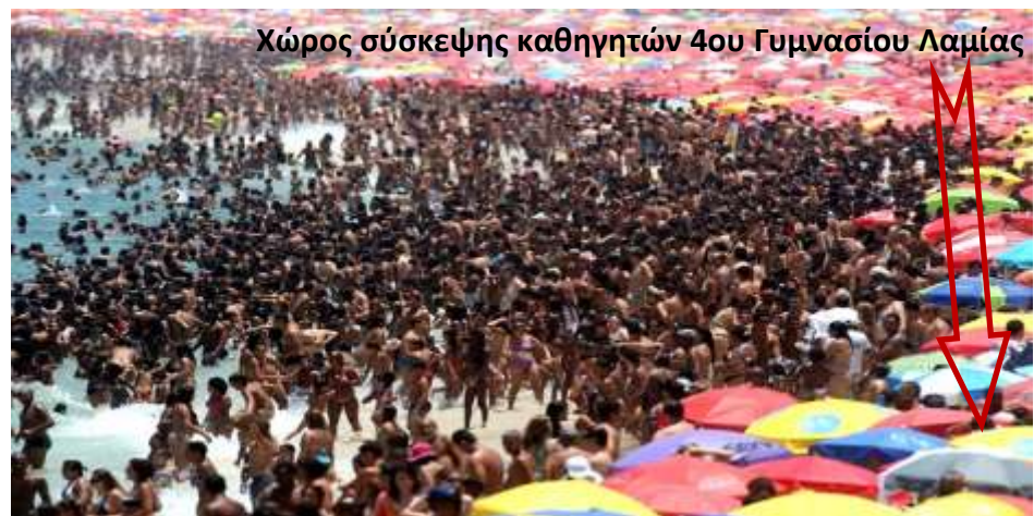
Χώρος σύσκεψης καθηγητών 4ου Γυμνασίου Λαμίας