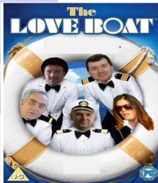
...κατόπιν θα ξεκουραστεί.