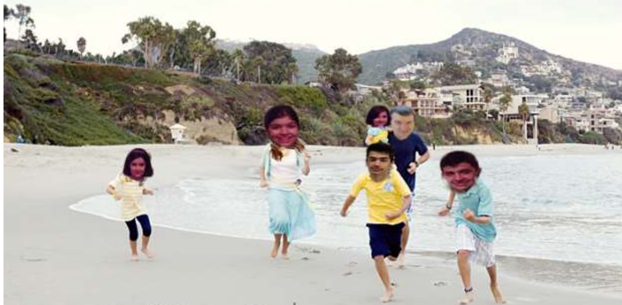
Ο κ. Λαδάς θα περάσει ανέμελες οικογενειακές διακοπές