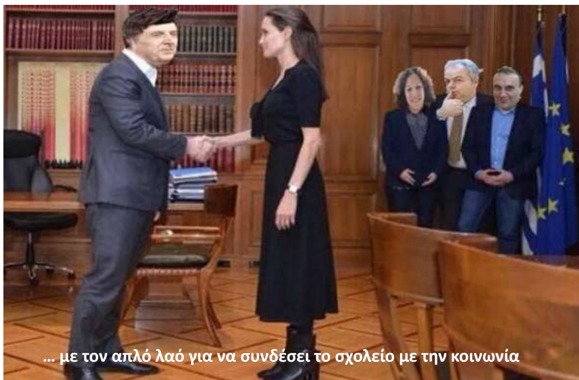
... με τον απλό λαό για να συνδέσει το σχολείο με την κοινωνία