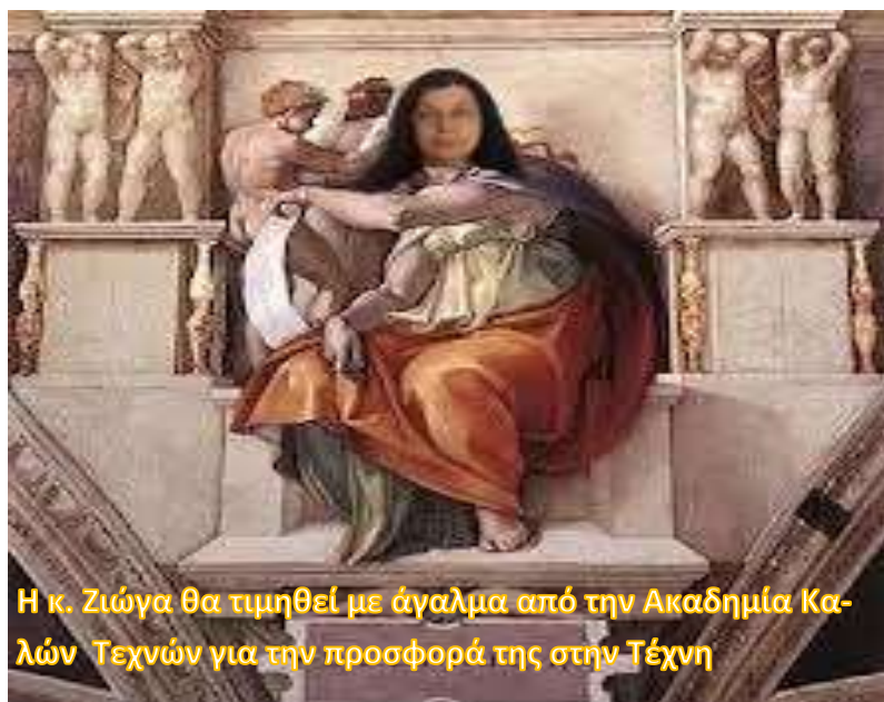
Η κ. Ζιώγα θα τιμηθεί με άγαλμα από την Ακαδημία Καλών Τεχνών για την προσφορά της στην Τέχνη