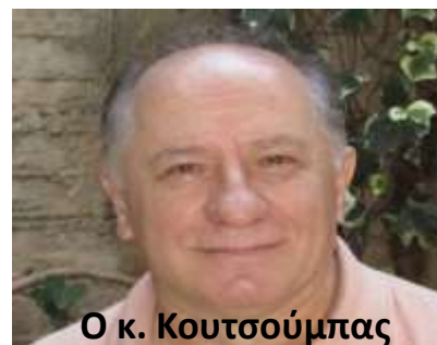
Ο κ. Κουτσούμπας