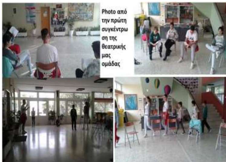
Photo από την πρώτη συγκέντρωση της θεατρικής μας ομάδας