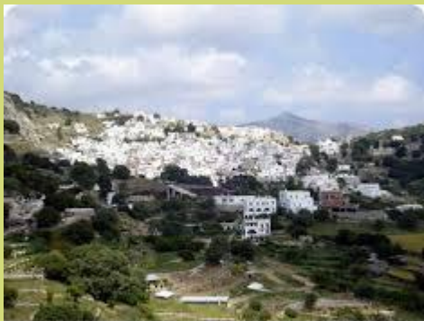
Στ' Απεράθου ομορφά' ναι, όποια εποχή και νά' ναι...