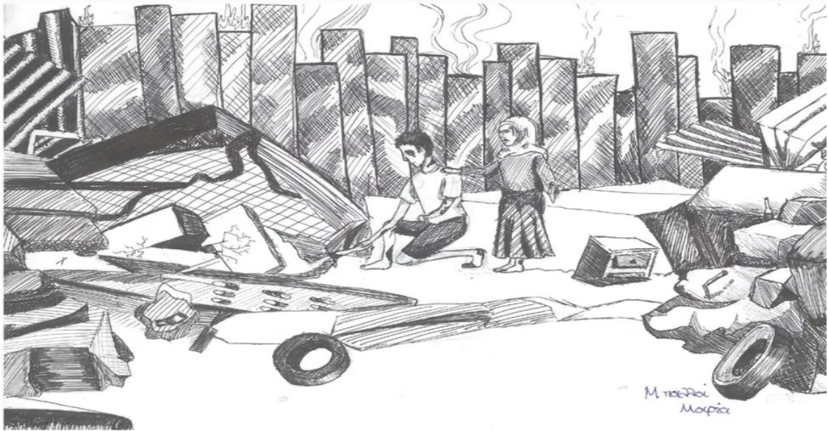
ΓΕΛ Χορτιάτη - Ο Γυάλινος Κόσμος