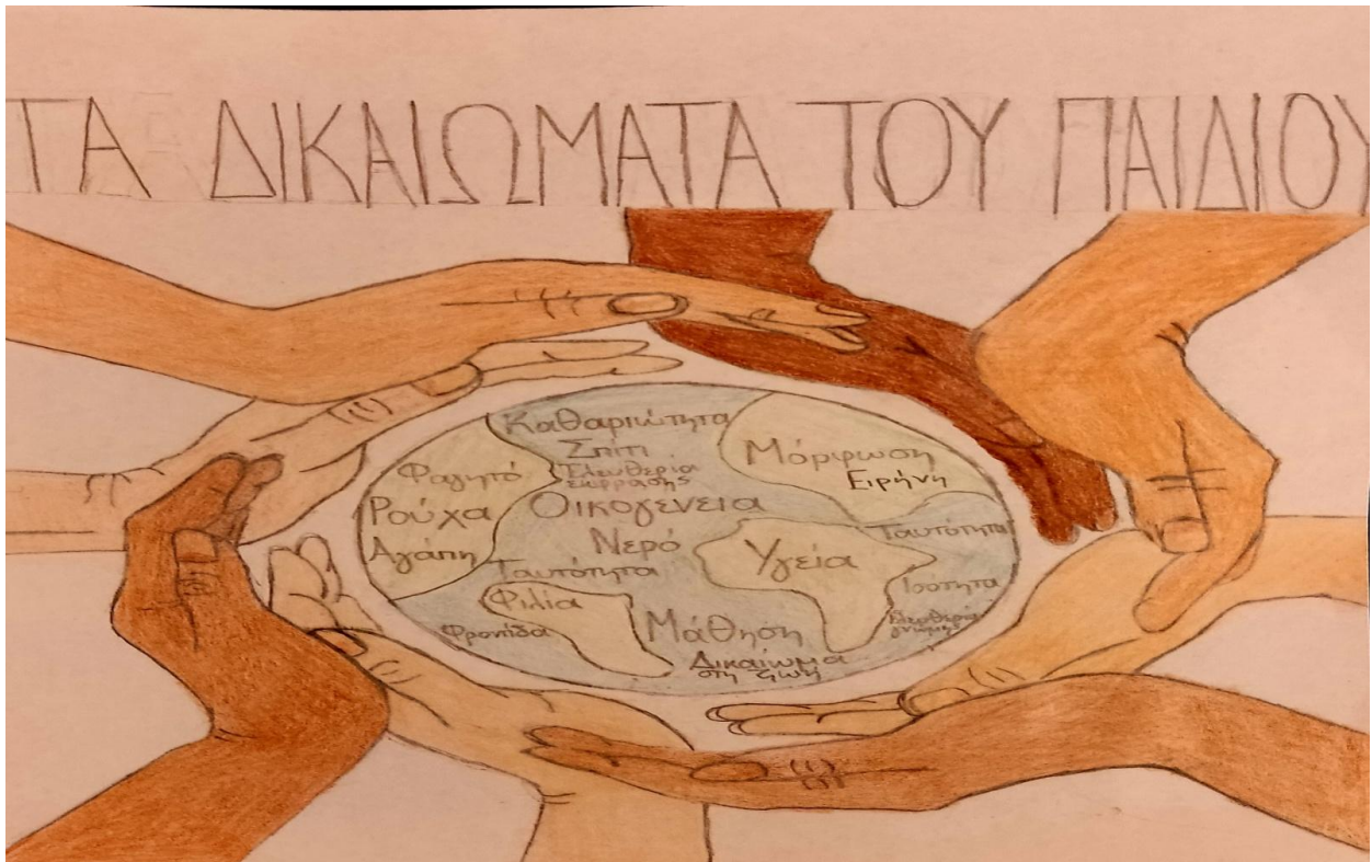
50 ο Γυμνάσιο Αθηνών - Click στη γνώση