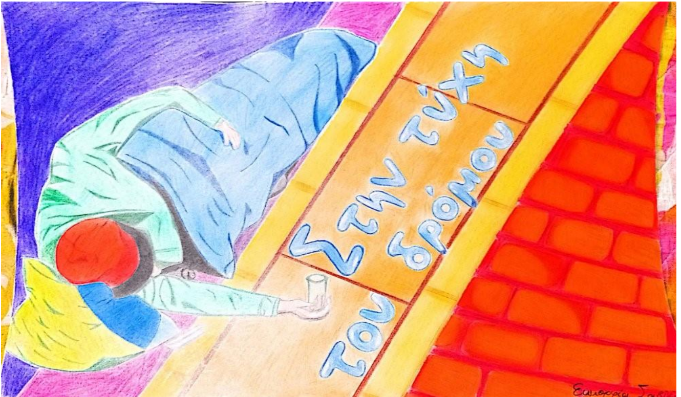
2 ο ΓΕΛ Ελευθερίου - Κορδελιού – Αποκόμματα εφημερίδων