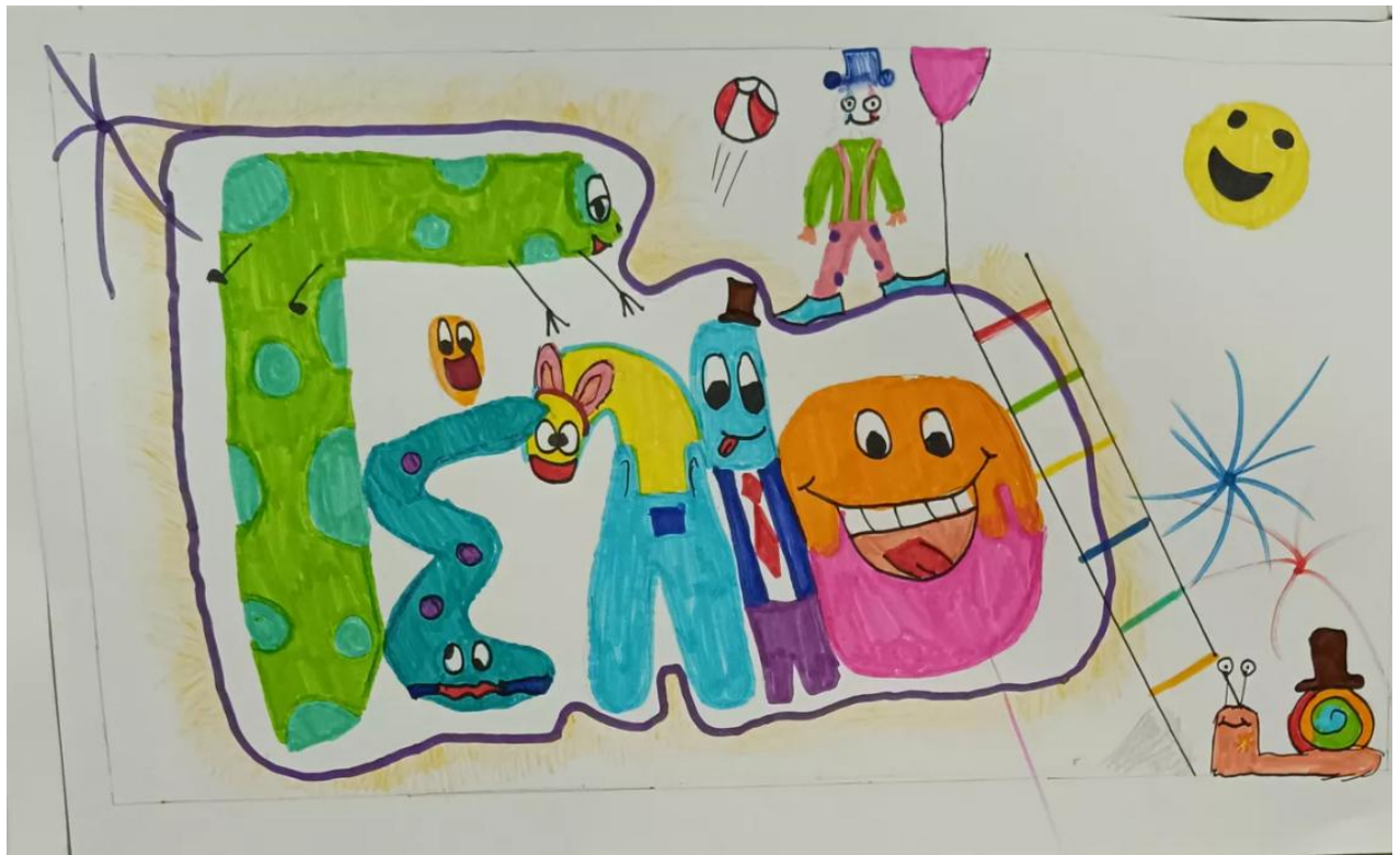
2 ο Γυμνάσιο Σπάρτης - Σχολική Σφαίρα