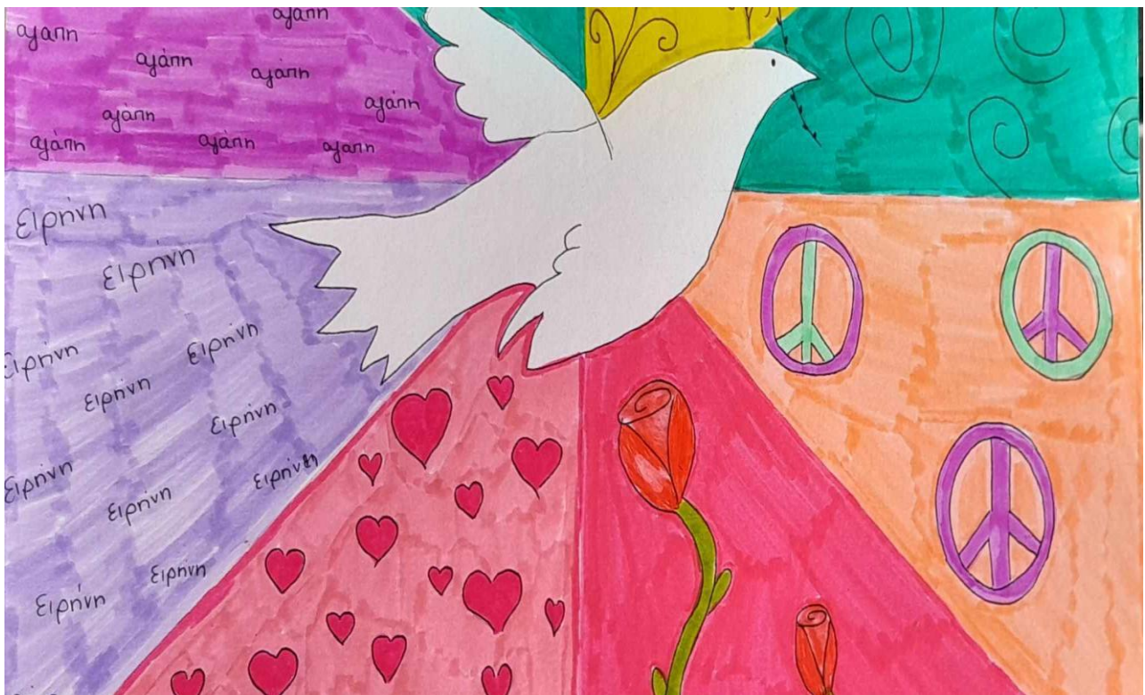
5 ο Πρότυπο Γυμνάσιο Χαλκίδας