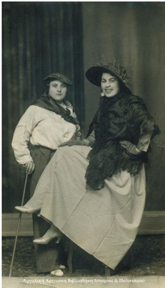
Αργολική Αρχαική Βιβλιοθήκη Ιστορίας & Πολιτισμού