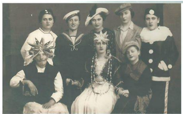
ΑΠΟΚΡΙΕΣ ΣΤΗΝ ΤΡΙΠΟΛΗ 1927