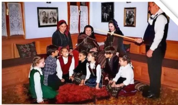
Χάσκα (αποκριτικό παιχνίδι)

Τον πλάστη πιάνει ο άρχοντας, που 'χει χαλβά δεμένο, γιατί προσμένουν τα παιδιά, το Χάσκα τους να κάνουν.