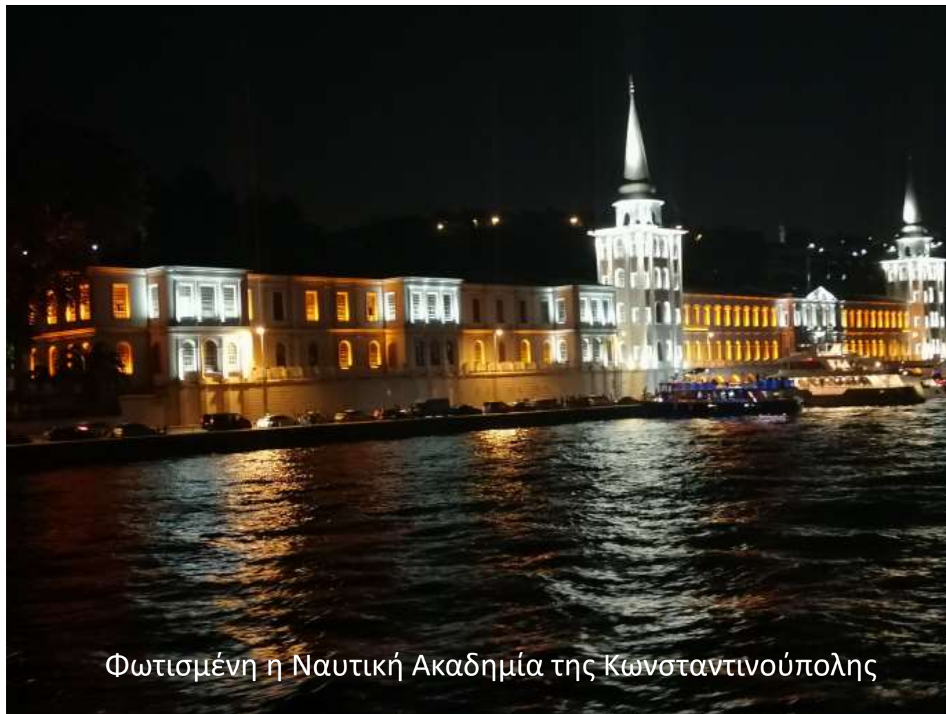
Φωτισμένη η Ναυτική Ακαδημία της Κωνσταντινούπολης

Ο Βόσπορος: Βραδινή βόλτα με το καραβάκι με θέα την φωτισμένη Πόλη.