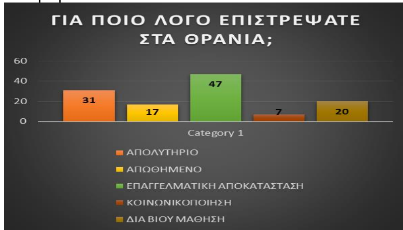
Σχήμα 2:Οι απαντήσεις της έρευνας αξιολογήθηκαν

λύκειο τους δίνει την δυνατότητα να αποκτήσουν πτυχίο ειδικότητας και στη συνέχεια αν ενδιαφέρονται να φοιτήσουν στο νέο θεσμό του προαιρετικού «Μεταλυκειακού Έτους-Τάξη Μαθητείας»(λεπτομέρειες στο επόμενο τεύχος) και μετά από συμμετοχή σε εξετάσεις πιστοποίησης να αναβαθμίσουν το πτυχίο του σε επίπεδο 5.Επίσης το 31% επέστρεψε για το απολυτήριο, το 20% γιατί θεωρεί ότι η γνώση δεν σταματάει ποτέ το, 17% λόγω απωθημένου και το 7% για κοινωνικοποίηση.