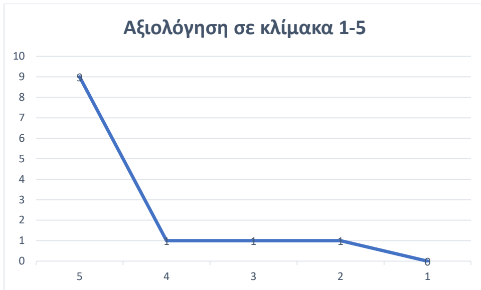
Εικόνα 3. Συνολική Αξιολόγηση