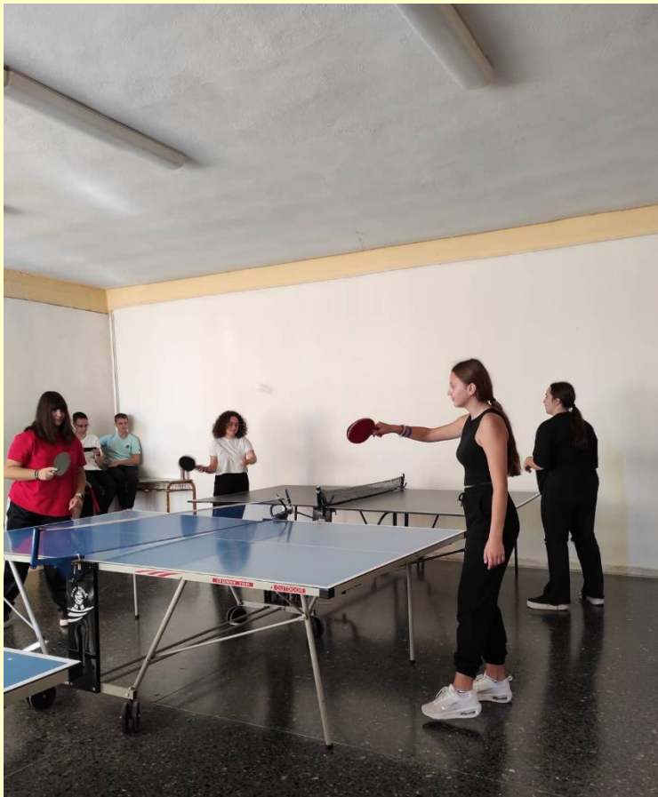
Πινγκ - Πονγκ