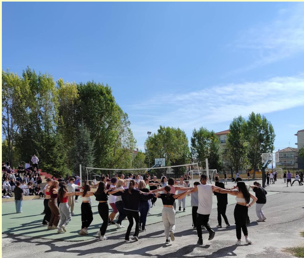
Full 2 press