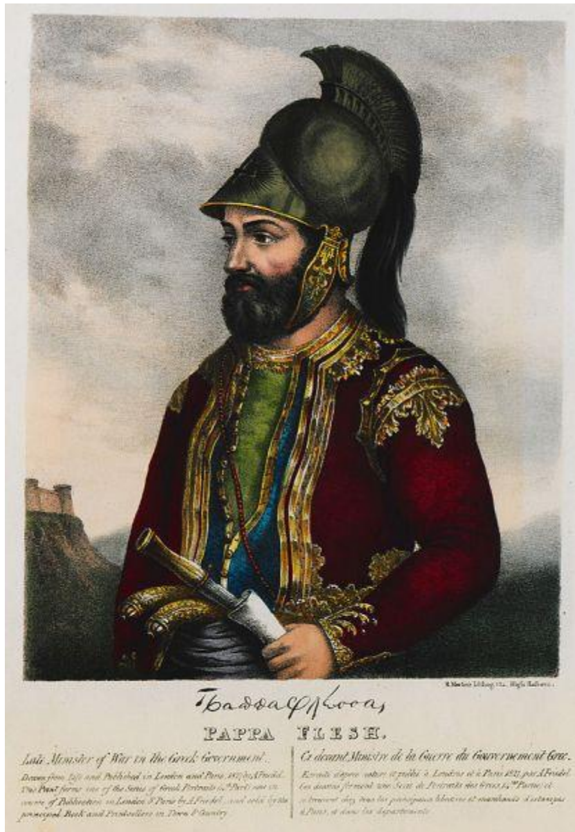
Του Φρίντελ Άνταμ

Η παράτολμη και ριψοκίνδυνη άνευ λήψης μέτρων φύλαξης τακτική του προβλημάτιζε τα ηγετικά στελέχη της Φιλικής Εταιρείας. Υπήρχε ο φόβος της αποκάλυψης των σχεδίων της. Έτσι αποφασίστηκε να σταλεί ο Παπαφλέσσας στον Μοριά, όπου οι συνθήκες ήταν ευνοϊκότερες για οργανωτική δράση. Εκεί αναδείχθηκε φλογερός πατριώτης. Επιθυμούσε διακαώς την έναρξη της επανάστασης και χρησιμοποίησε κάθε μέσο για να το επιτύχει. Μάλιστα με την επιστροφή του στην Κωνσταντινούπολη, υποστήριξε ότι η Πελοπόννησος ήταν έτοιμη για δράση και, για να επιβεβαιώσει τα λεγόμενα του, παρουσίασε πλαστά έγγραφα. Αν και διαψεύστηκε από το Σπύρο, ο Αρχιμανδρίτης δεν συμμορφώθηκε. Φανερά εκνευρισμένος για την έκβαση της συζήτησης, απευθυνόμενος στους συμμετέχοντες είπε: « Έχετε καρδιά, έχετε πίστη..... αλλιώς καθείστε εκει πο κάθεστε.... ραγιαδες όλα σας τα