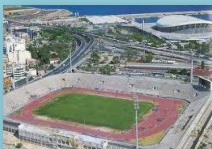
Το γήπεδο "Καραϊσκάκης" πριν το 2003

Βέβαια, το ποδηλατοδρόμιο σήμερα δεν υπάρχει καθώς αντικαταστάθηκε από το γήπεδο Γεώργιος Καραϊσκάκης το 1953.