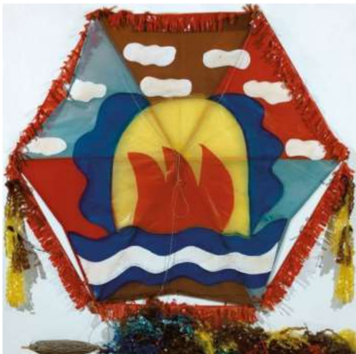
Νίκος Καρούζος (Τα ποιήματα Α' (1961-1978), εκδ. Ίκαρος)