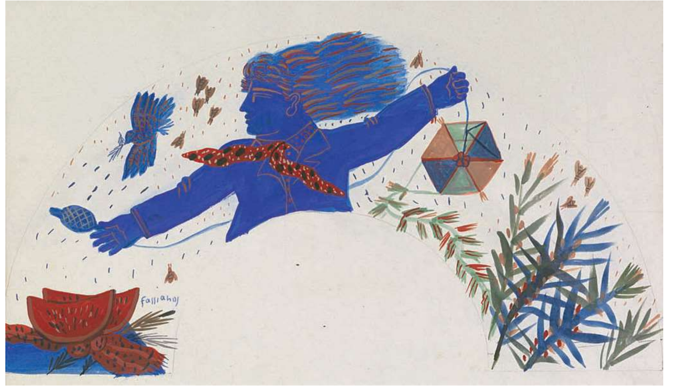
Χαρταετός, Αλέκος Φασιανός