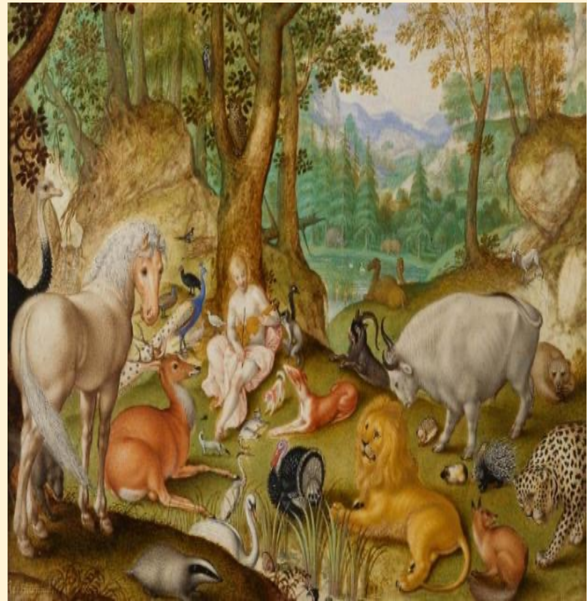
Εβελίνα Τσαρούχα, Α3

Ας επιχειρήσουμε, λοιπόν, να γνωρίσουμε τον μαγικό και ξεχωριστό κόσμο τους καθώς και τον ισχυρό δεσμό τους με τους ανθρώπους μέσα από διάφορα λογοτεχνικά έργα.