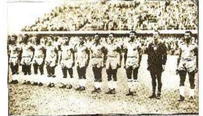
Η ΒΡΑΖΙΛΙΑ ΤΟ 1958