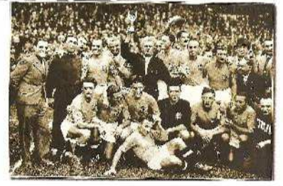
Η ΙΤΑΛΙΑ ΤΟ 1938