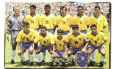
Η ΒΡΑΖΙΛΙΑ ΤΟ 1994