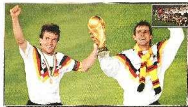
Η Δ. ΓΕΡΜΑΝΙΑ ΤΟ 1990