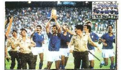
Η ΙΤΑΛΙΑ ΤΟ 1982