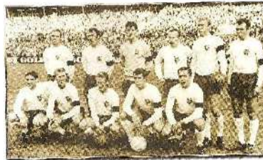
Η ΑΓΓΛΙΑ ΤΟ 1966