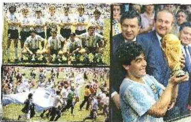
Η ΑΡΓΕΝΤΙΝΗ ΤΟ 1986