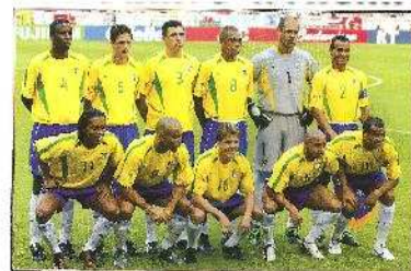
Η ΒΡΑΖΙΛΙΑ ΤΟ 2002