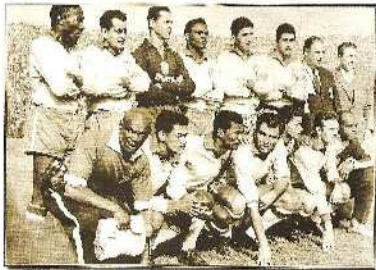
Η ΒΡΑΖΙΛΙΑ ΤΟ 1962