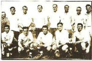
Η ΟΥΡΟΥΓΟΥΑΗ ΤΟ 1930