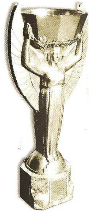
Αυτό ήταν το τρόπαιο των νικητών από το 1930-1970.

Μετά από όλα αυτά τα έτη και τις πολλές αλλαγές που πέρασε ο πλανήτης μας, ο κύριος σκοπός του Παγκοσμίου Κυπέλλου της FIFA παραμένει ο ίδιος: το αστραφτερό χρυσό τρόπαιο που είναι και το κρυφό όνειρο κάθε ποδοσφαιριστή.