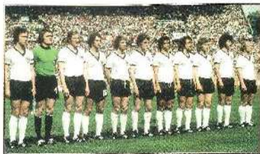
Η Δ. ΓΕΡΜΑΝΙΑ ΤΟ 1974