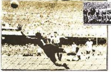
Η ΟΥΡΟΥΓΟΥΑΗ ΤΟ 1950