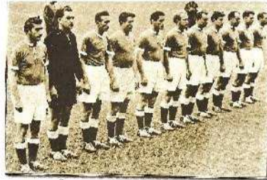
Η Δ. ΓΕΡΜΑΝΙΑ ΤΟ 1954