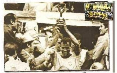
Η ΒΡΑΖΙΛΙΑ ΤΟ 1970