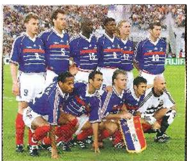
Η ΓΑΛΛΙΑ ΤΟ 1998