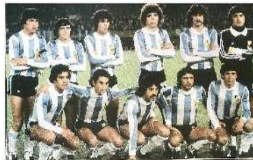
Η ΑΡΓΕΝΤΙΝΗ ΤΟ 1978