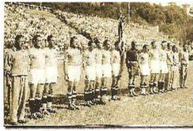
Η ΙΤΑΛΙΑ ΤΟ 1934