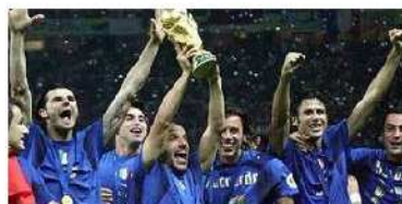
Η ΙΤΑΛΙΑ ΤΟ 2006