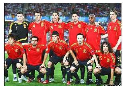
Η ΙΣΠΑΝΙΑ ΤΟ 2010