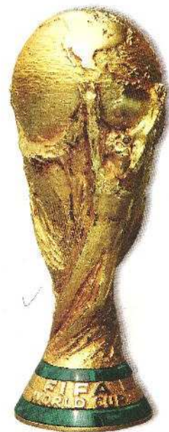
Το νέο τρόπαιο των νικητών από το 1974 μέχρι και σήμερα.