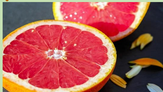
Γκρέιπφρουτ - Une pamplemousse