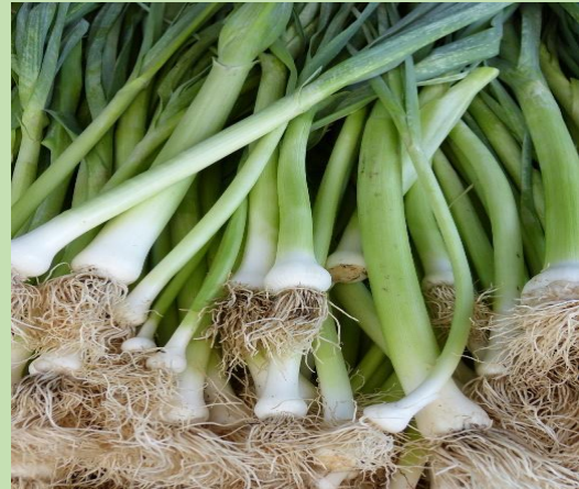
Des oignons verts