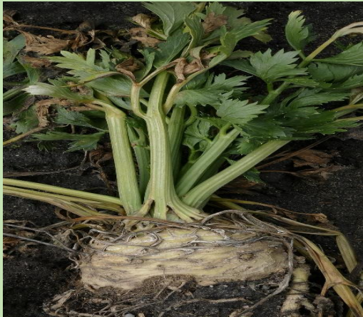
Des racines de céleri