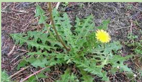
Ραδίκι- la chicorée