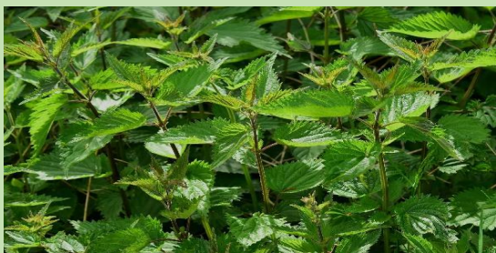
Κνίδη η δίοικος (Τσουκνίδα)-

Ο μήνας Δεκέμβριος μας προσφέρει πολλά φαγώσιμα χόρτα και βότανα τα οποία μας βοηθούν να αντιμετωπίσουμε διάφορες ιώσεις.