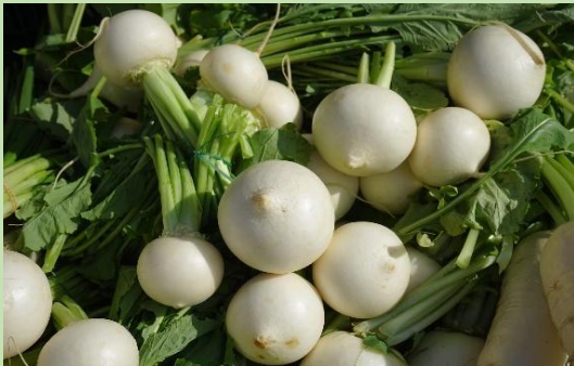
Ραπάνι - Le radis