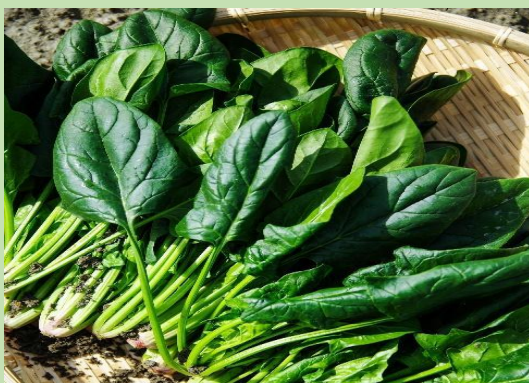
Σπανάκι - Un épinard