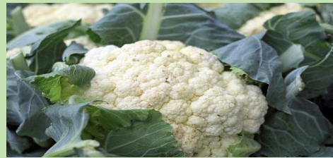
Un chou fleur