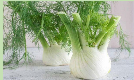
Μάραθος/Ψινόκιο - Le fenouil