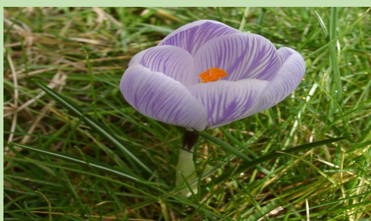
Le crocus de Kozanis