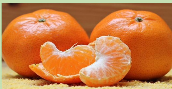
Κλημεντίνες - Des clémentines