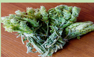
Thé de la montagne