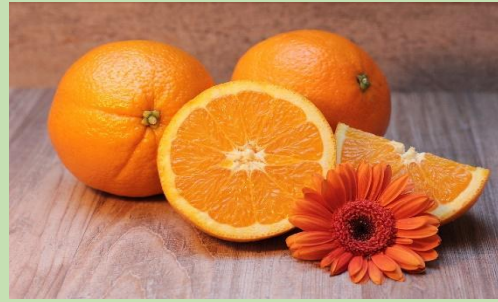
Πορτοκάλια - Des Oranges