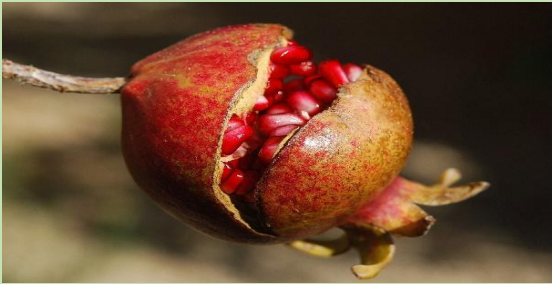
Ρόδι - Une grenade

Les légumes de décembre sont les suivants :