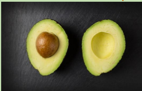
Αβοκάντο - Un avocat

Les fruits et les légumes de ce mois sont vraiment délicieux, savoureux et plein de jus. Ses fruits sont: