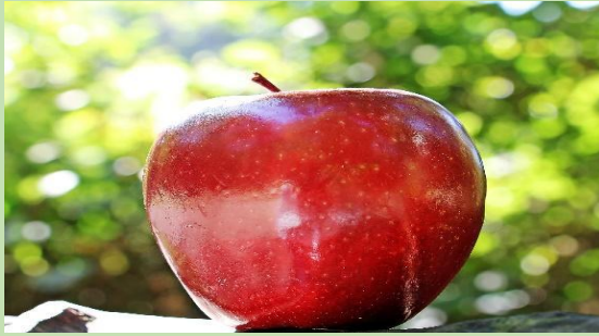
Μήλα - Des pommes