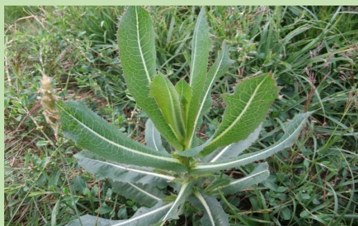
Πετρομάρουλο- La laitue de roche