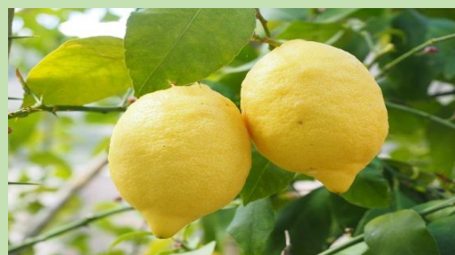
Λεμόνια - Des citrons