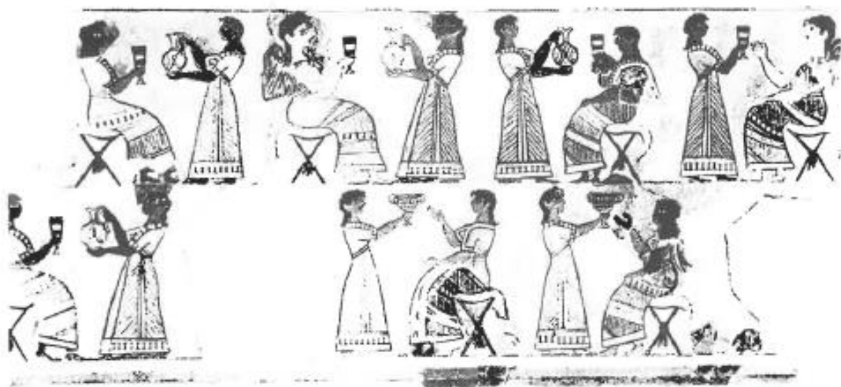
Εικ. 15.3: Αναπαράσταση της ΥΜ τοιχογραφίας της «Ιερής Κοινωνίας». Κνωσός [R. Hägg, N. Marinatos (eds.), The Function of the Minoan Palaces , 1987, fig. 6].