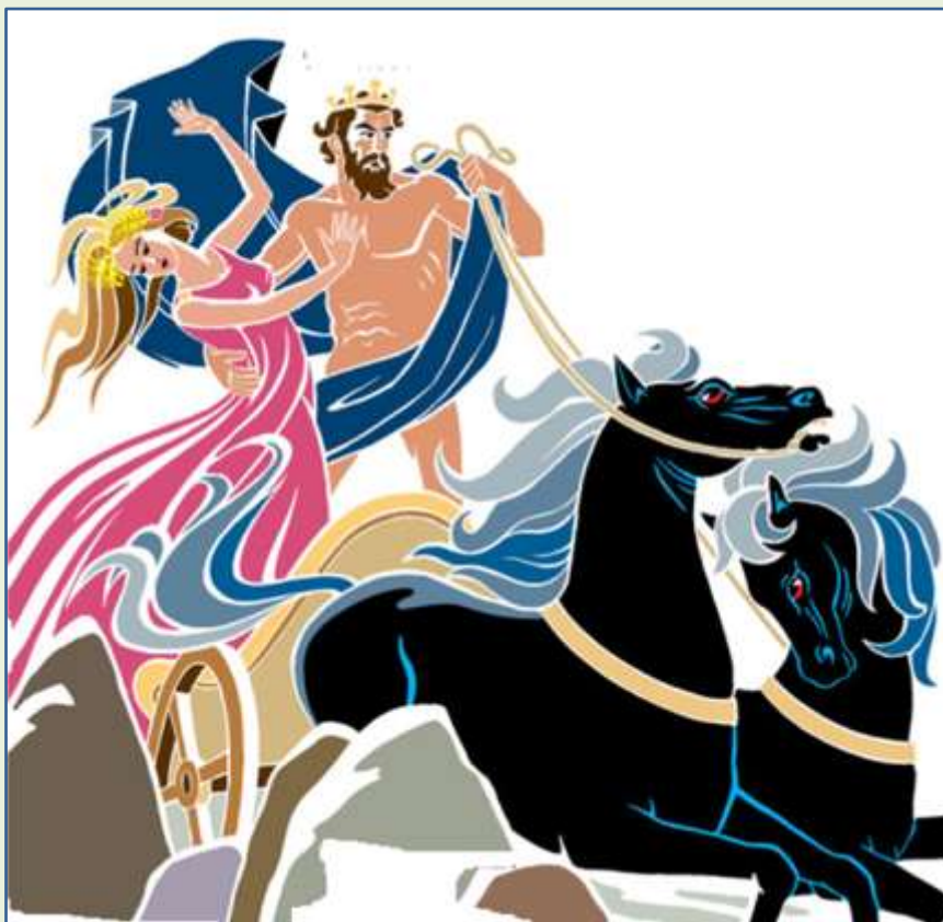
Ο Πλούτωνα αρπάζει την Περσεφόνη

Όταν έσκυψε να πιάσει έναν νάρκισσο, η γη χωρίστηκε στη μέση και από τα έγκατα εμφανίσθηκε ένα άρμα. Οδηγός ήταν ο Πλούτωνα, που με το ένα χέρι κρατούσε τα χαλινάρια των αλόγων και με το άλλο άρπαξε την πανέμορφη κοπέλα. Οι κραυγές της δεν ακούστηκαν από κανέναν και η Περσεφόνη κατέβηκε στον Κάτω Κόσμο.