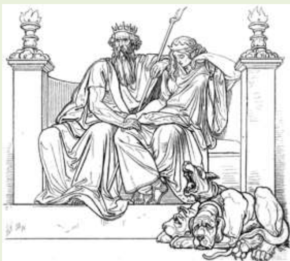
Η Περσεφόνη στον Άδη με τον Πλούτωνα

Έτσι η κοπέλα θα περνούσε το μισό χρόνο δίπλα στην μητέρα της και τον άλλο μισό με τον Πλούτωνα. Η Δήμητρα αποδέχτηκε την απόφαση, αλλά δεν ξεπέρασε ποτέ το χαμό της κόρη της. Έκτοτε τους έξι μήνες που η Περσεφόνη βρισκόταν στον Άδη, η Δήμητρα πενθούσε και μαζί της πενθούσε και η φύση. Τα δέντρα έχαναν το φύλλωμά τους, οι καλλιέργειες ασθενούσαν και βαρύς χειμώνας έπεφτε στη γη.