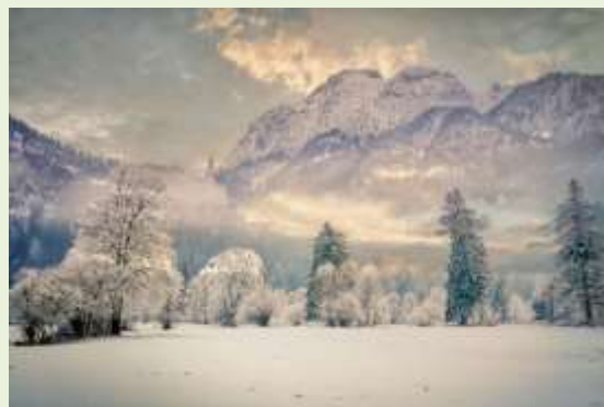
Χειμώνας πάνω στη Γη

Όμως, όταν η Περσεφόνη επέστρεφε στη μητέρα της, η χαρά της Δήμητρας πρασίνιζε τη γη και άνθιζε τα φυτά. Και έτσι στη Γη ερχόταν η Άνοιξη και το Καλοκαίρι.