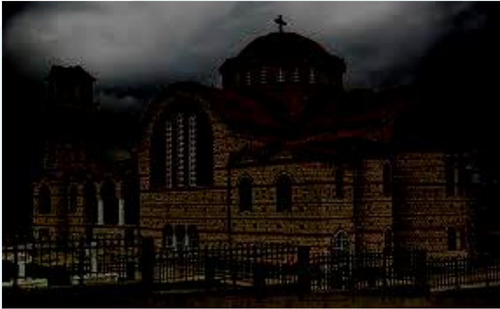
Άγιος Γεώργιος Αναρράχης