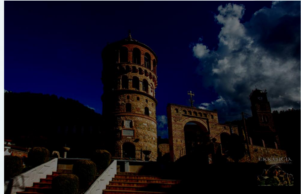
Άγιος Μηνάς Εμπορίου