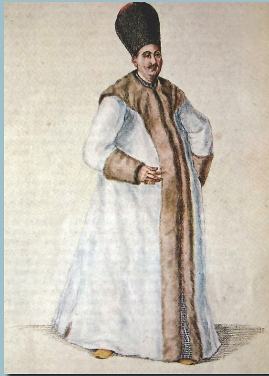
Προεστός του 18ου αιώνα με την επίσημη στολή του