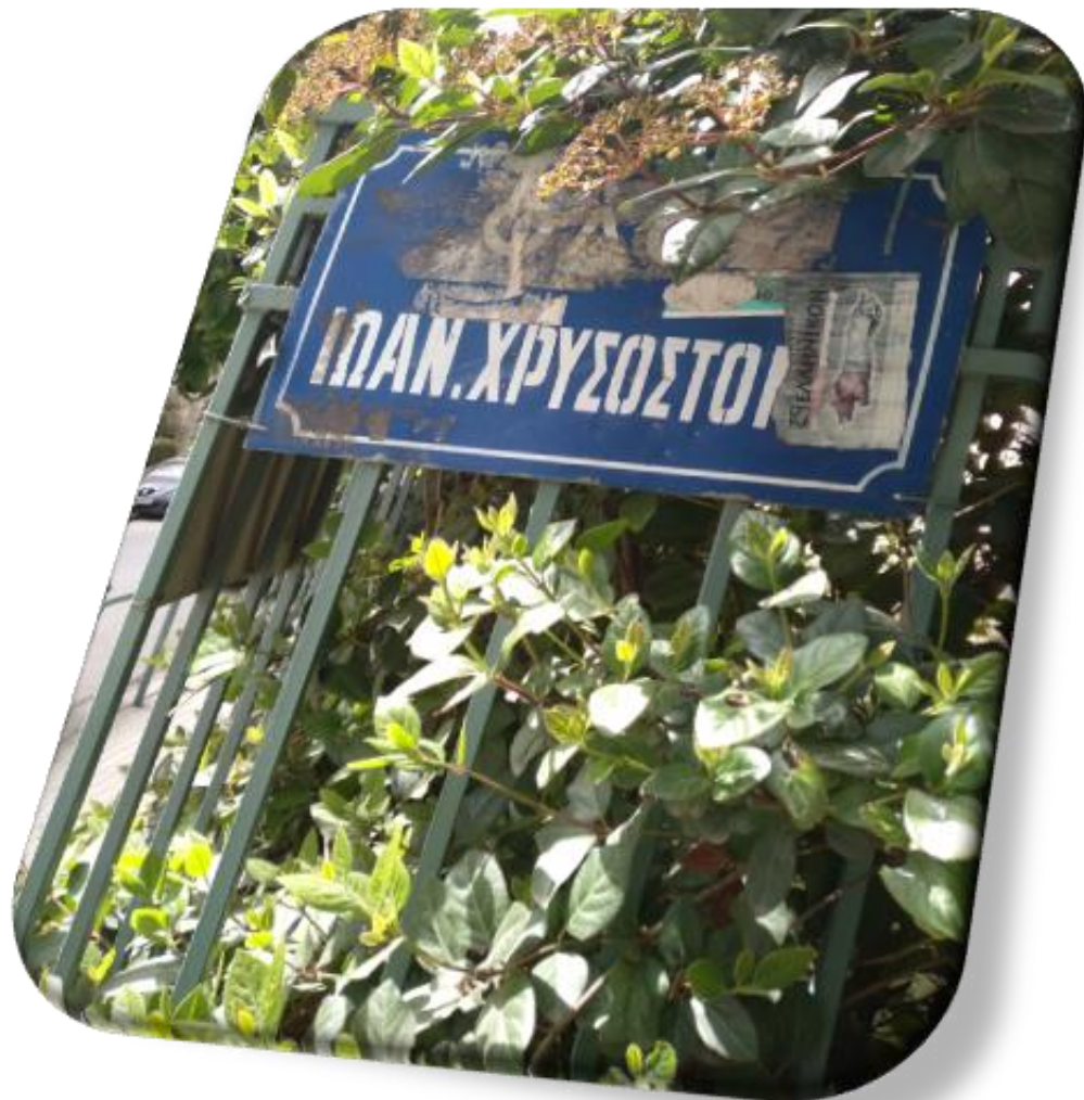
ΟΔΟΣ ΙΩΑΝΝΟΥ ΧΡΗΣΟΣΤΟΜΟΥ