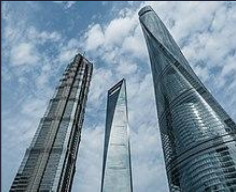
Το Παγκόσμιο Οικονομικό Κέντρο της Σαγκάης