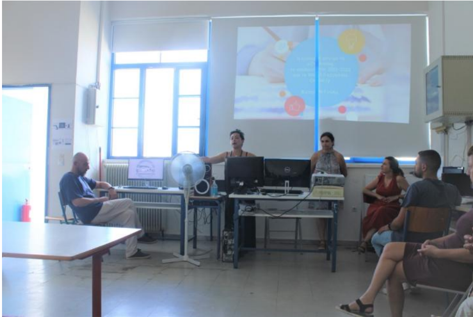
Στιγμιότυπο από το Εργαστήριο-Workshop που πραγματοποιήθηκε στις 28/6/2022

που συμμετείχαν στις κινητικότητες παρουσίασαν στους συναδέλφους τους χρήσιμα εργαλεία και εκπαιδευτικές πρακτικές, δίνοντάς τους τη δυνατότητα να ασκηθούν στη χρήση τους. Στο τέλος της επιμορφωτικής συνάντησης δεν έλειψε και... το παιχνίδι, καθώς οι συνάδελφοι κλήθηκαν να συμμετάσχουν σε ένα κυνήγι θησαυρού.