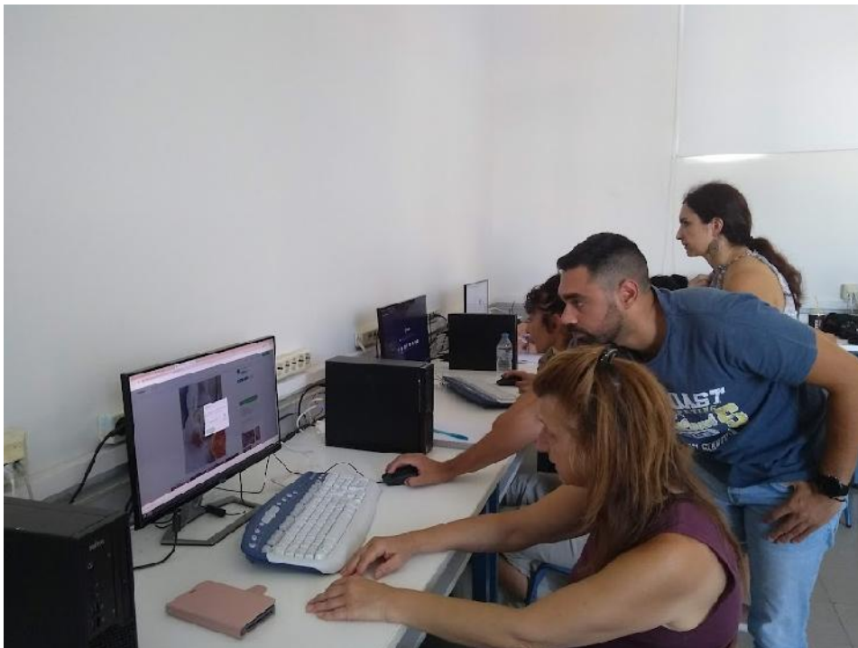
Στιγμιότυπο από το Εργαστήριο-Workshop