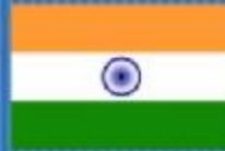
Σημαία της Ινδίας