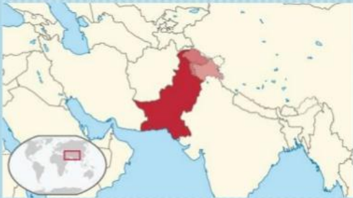
Η θέση του Πακιστάν