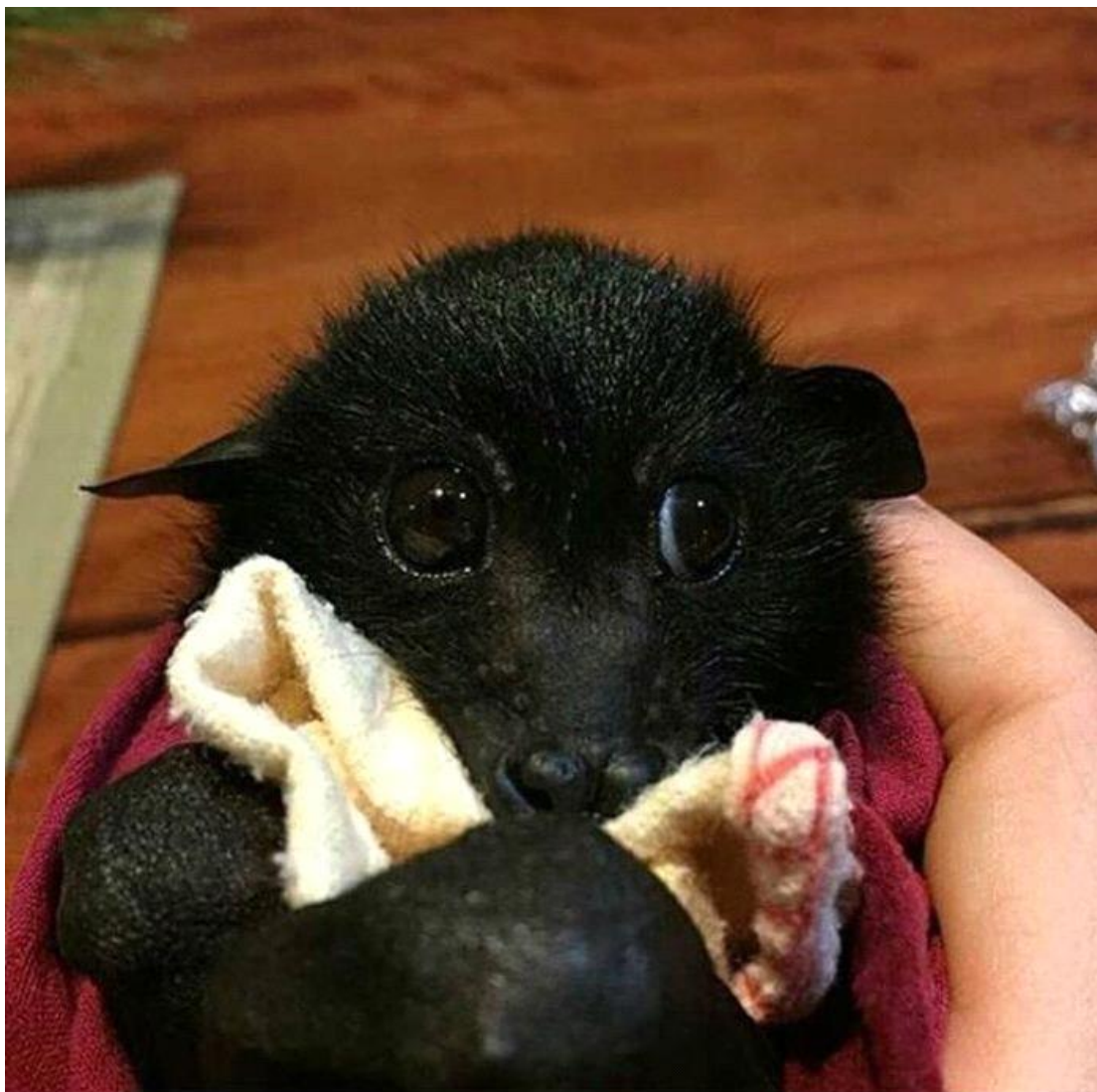
ΣΕΜΠΑΣΤΙΑΝ ΟΥΝΓΚΟΥΡΕΑΝΟΥ, Α6