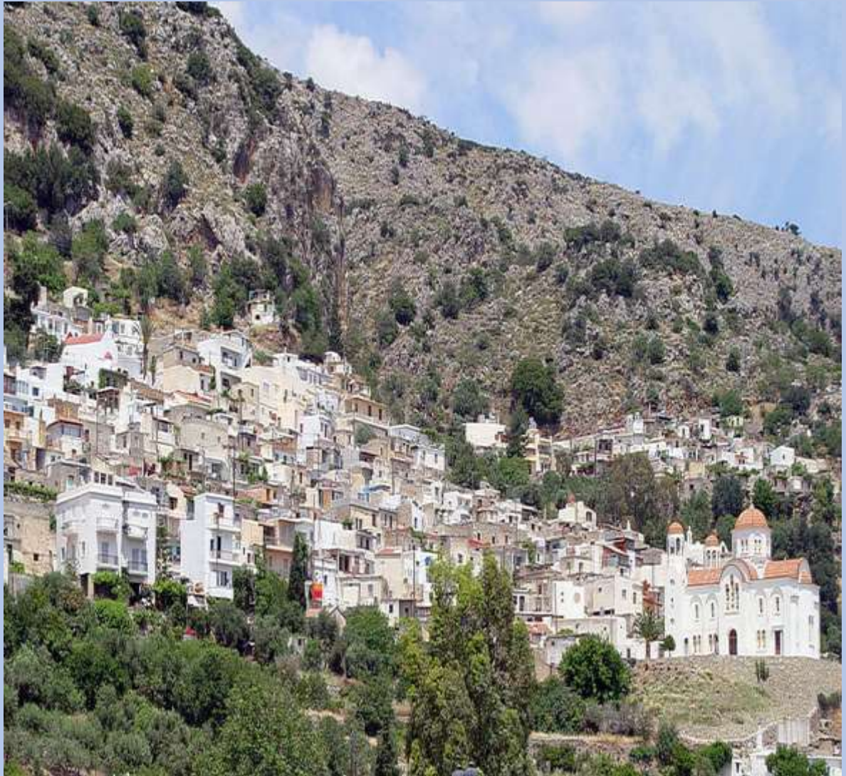
Ο παραδοσιακός οικισμός Κριτσά στον Άγιο Νικόλαο Κρήτης

Το χωριό Κριτσά είναι ένας ιστορικός παραδοσιακός οικισμός στην περιφέρεια του Λασιθίου. Είναι χτισμένο αμφιθεατρικά στους πρόποδες του όρους Κάστελλος σε υψόμετρο 330-365 μέτρων. Αν θέλετε να πάρετε μια γεύση από την παραδοσιακή ζωή της Κρήτης, αυτή είναι μια εξαιρετική επιλογή.