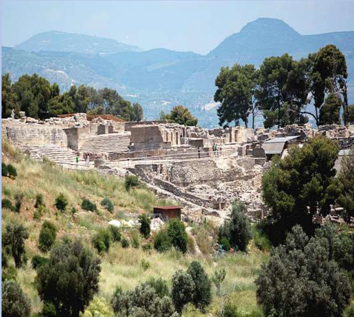
Αρχαιολογικός χώρος - Μινωικό Ανάκτορο Φαιστού

Το δεύτερο μεγαλύτερο παλάτι της Κρήτης μετά την Κνωσό, είναι η Φαιστός . Πρόκειται για την κατοικία του αδελφού του βασιλιά Μίνωα, του Ραδάμανθου . Βρίσκεται στο νότιο μέρος του Ηρακλείου, κοντά στην παραλία Μάταλα και έχει φόντο τις εντυπωσιακές πεδιάδες. Η Φαιστός ξεκίνησε ως φυλάκιο της νεολιθικής εποχής και το 1700 π.Χ. ήταν μια ακμάζουσα πόλη. Εκεί βρέθηκε ο Δίσκος της Φαιστού , ένας δίσκος ψημένου πηλού και είναι άγνωστος ο σκοπός κατασκευής του μέχρι και σήμερα, που φυλάσσεται στο Αρχαιολογικό Μουσείο Ηρακλείου.