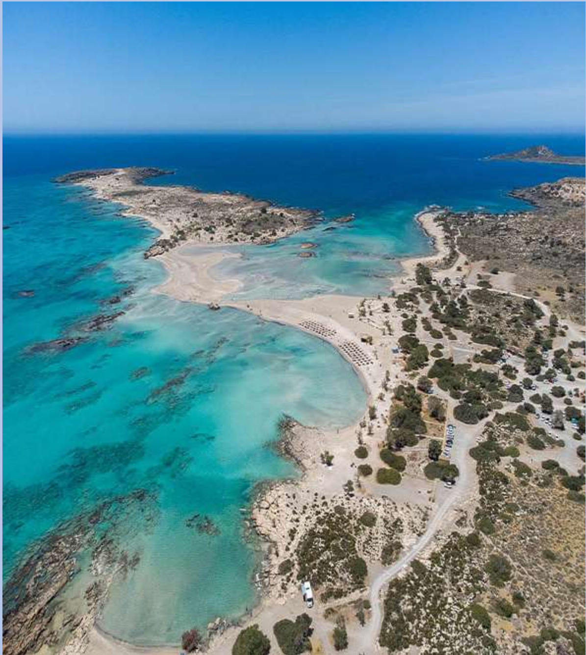
Η παραλία Ελαφονήσι στα Χανιά

Το Ελαφονήσι θεωρείται μια από τις ομορφότερες παραλίες στον κόσμο. Μοιάζει να είναι σαν τον παράδεισο, καθώς πρόκειται για μια τεράστια θαλάσσια έκταση με γαλάζιες λιμνοθάλασσες και ροζ άμμο. Είναι ένα από τα πιο φωτογραφημένα σημεία της Κρήτης και βρίσκεται στην δυτική ακτή, στα Χανιά. Το τοπίο είναι μαγευτικό και μαζεύει πολύ κόσμο. Αν είστε δραστήριοι μπορείτε να ακολουθήσετε το μονοπάτι στα αριστερά της παραλίας για να βγείτε σε έναν άλλο επίγειο παράδεισο, το Κεδρόδασος .