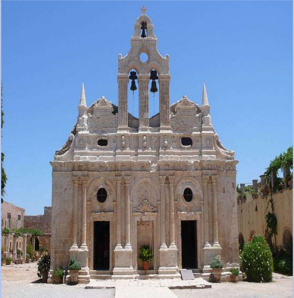
Ιερά Μονή Αρκαδίου

Η Μονή Αρκαδίου βρίσκεται νοτιοανατολικά της πόλη του Ρεθύμνου και είναι ένα από τα αγαπημένα εθνικά ορόσημα του νησιού. Ιδρύθηκε τον 5ο αιώνα από τον Βυζαντινό Αυτοκράτορα Αρκάδιο και έπαιξε σημαντικό ρόλο στην Εξέγερση των Κρητικών το 1866 κατά των Οθωμανών. Περίπου 1.000 άνθρωποι κρύφτηκαν στο μοναστήρι για να σωθούν και τελικά επέλεξαν να θυσιάστούν ανατινάζοντας βαρέλια με πυρίτιδα παρά να παραδοθούν. Η σημερινή εκκλησία χρονολογείται από τον 16ο αιώνα από την εποχή της Αναγέννησης, η οποία είναι ορατή από την αρχιτεκτονική.