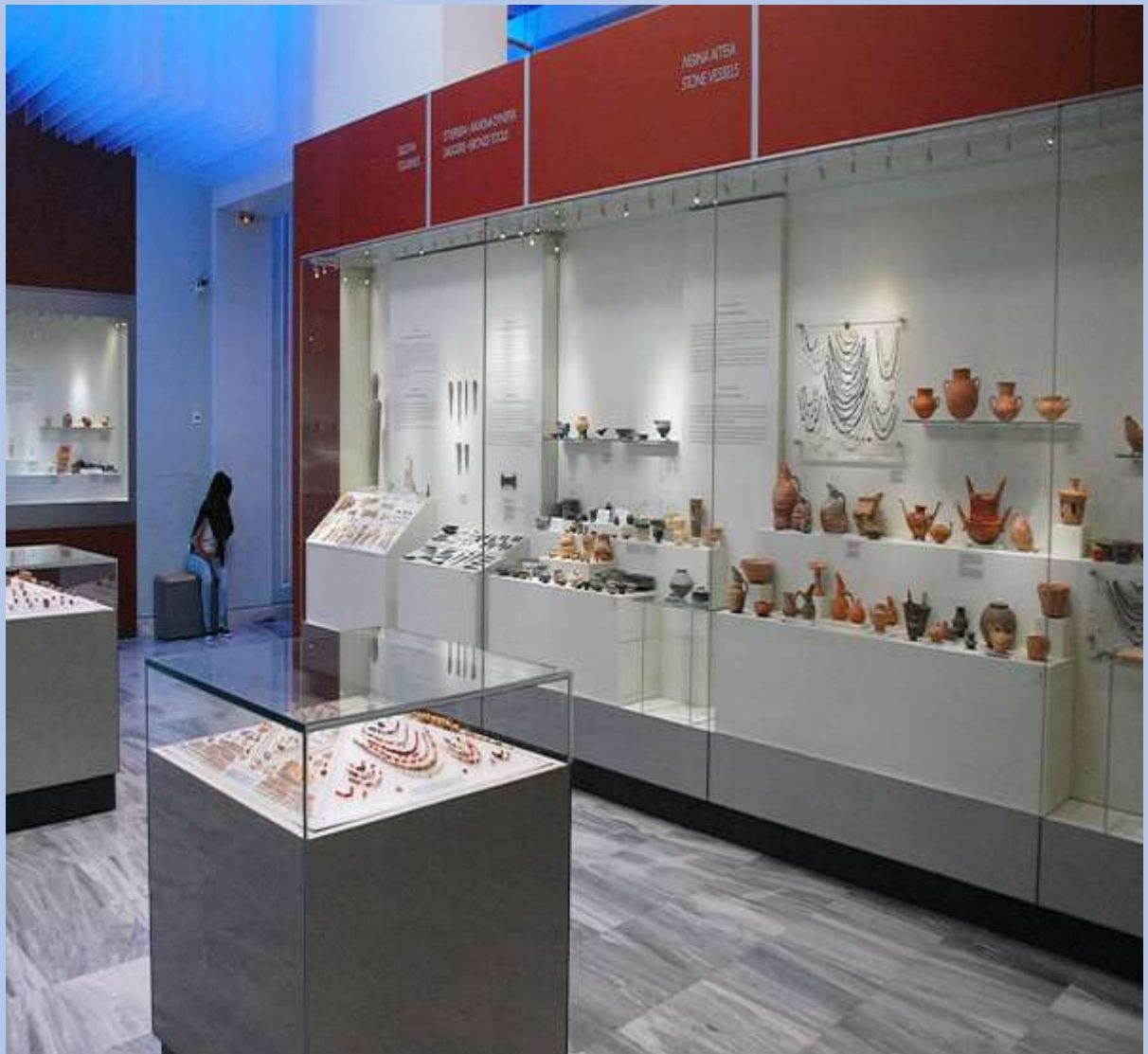
Αρχαιολογικό Μουσείο Ηρακλείου

Το Αρχαιολογικό Μουσείο Ηρακλείου προσφέρει μια συναρπαστική εμπειρία. Διαθέτει 20 γκαλερί που είναι διατεταγμένες χρονολογικά, με εκθέματα από τους παλαιότερους πολιτισμούς της Ευρώπης, νεολιθικά εργαλεία, μινωικά ειδώλια, όπλα, κοσμήματα, έπιπλα κ.α. Πολλά από τα εκθέματα του Μουσείου βρέθηκαν στο Παλάτι της Κνωσού και είναι από τα πιο εντυπωσιακά πράγματα που θα δείτε στην Κρήτη.