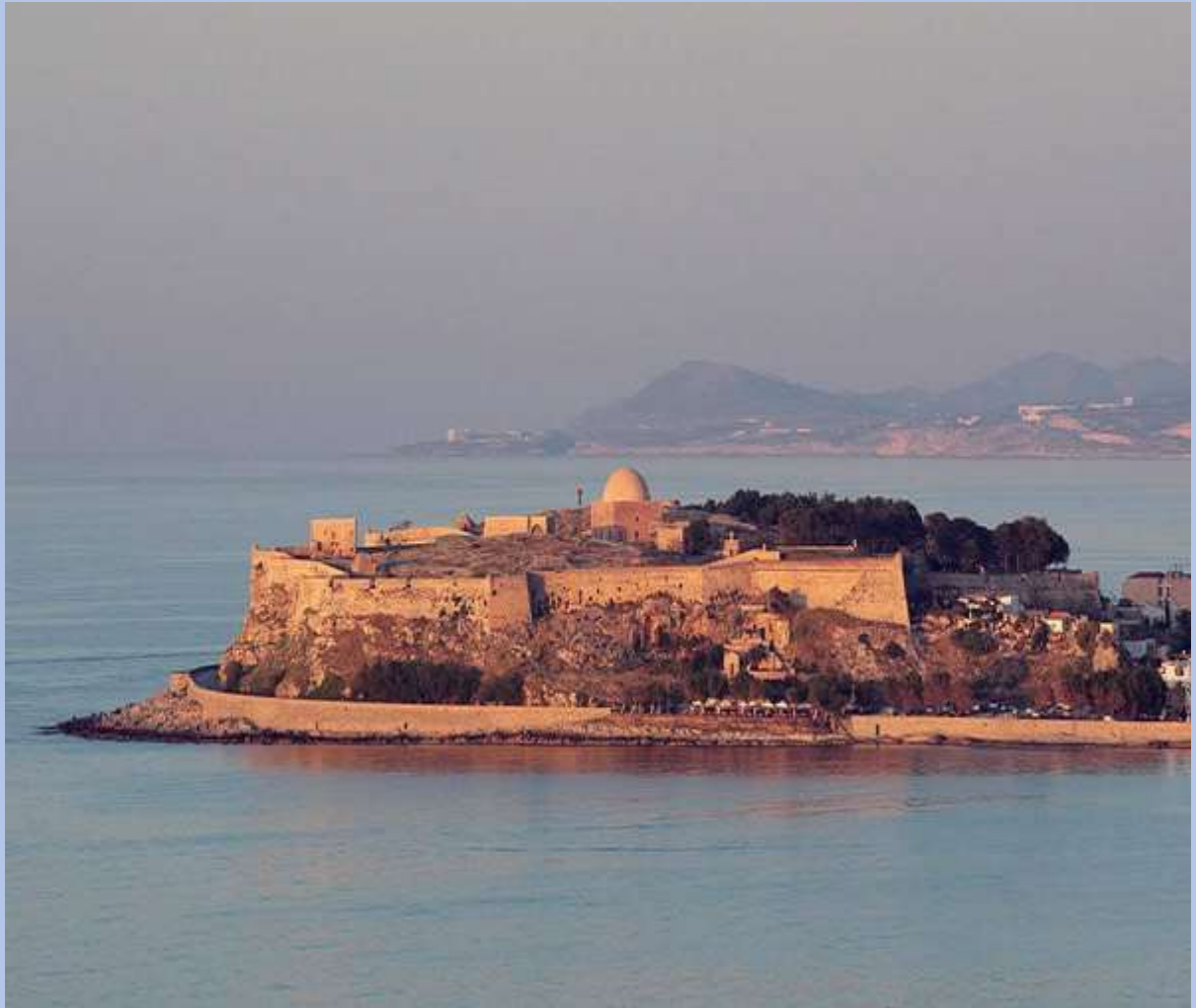
Το φρούριο Φορτέτζα στο Ρέθυμνο

Η Παλιά Πόλη του Ρεθύμνου είναι σαν να έχει βγει από παραμύθι. Αποτελείται από στενά λιθόστρωτα δρομάκια και μεσαιωνικά κτήρια. Εκεί θα βρείτε το Ενετικό Λιμάνι Ρεθύμνου και το φρούριο της Φορτέτζας , το οποίο έχτισαν οι Ενετοί το 1573.