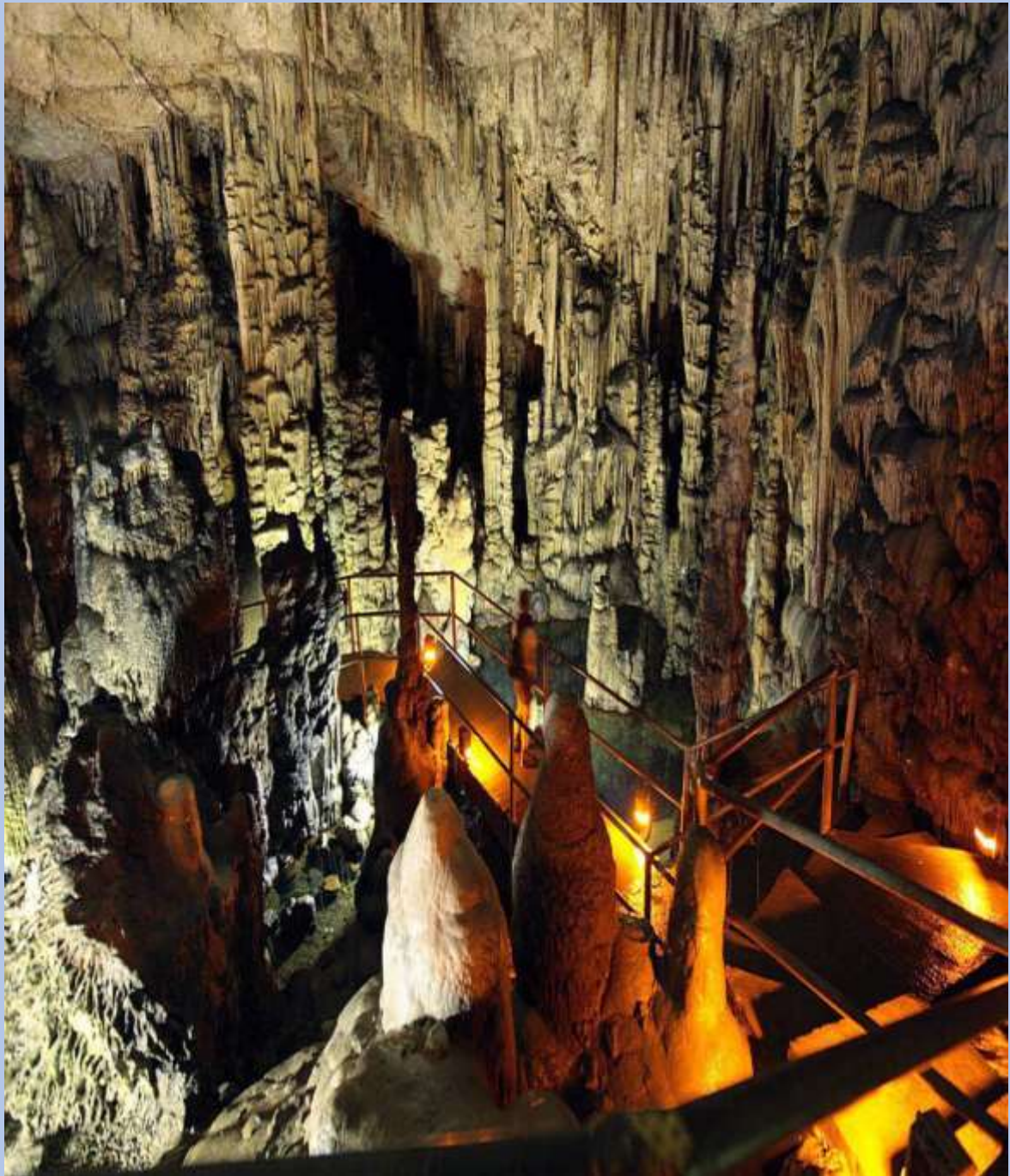
Το σπήλαιο Δικταίο Άντρο

Το Δικταίο Άντρο βρίσκεται στη βόρεια πλευρά του όρους Δίκη πάνω από το χωριό Ψυχρό στο Λασιθί, σε υψόμετρο 1.020μ. Πρόκειται για ένα από τα σημαντικότερα σπήλαια, το οποίο σύμφωνα με τη μυθολογία υπήρξε ο τόπος που γεννήθηκε ο Δίας. Το σπήλαιο συγκεντρώνει μεγάλο αριθμό επισκεπτών και ανασκαφών και έχουν βρεθεί ευρήματα από τη νεολιθική, μινωική, αρχαϊκή, κλασική και ρωμαϊκή εποχή.