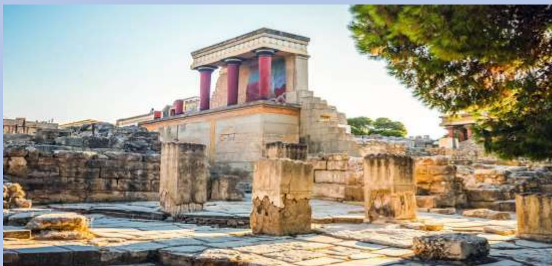
Το Μινωικό Παλάτι της Κνωσού

Ο Μινωικός Πολιτισμός είναι ο αρχαιότερος στην ιστορία της Ευρώπης, που χρονολογείται από την Εποχή του Χαλκού. Βρίσκεται λίγο πιο έξω από την πόλη του Ηρακλείου και είναι ένα από τα κορυφαία αξιοθέατα της χώρας. Το Παλάτι της Κνωσού κατασκευάστηκε περίπου πριν 3.000 χρόνια και ήταν το σπίτι του Βασιλιά Μίνωα . Εκεί βρίσκεται και ο διάσημος λαβύρινθος που έχτισε ο Δαίδαλος για να απομονώσουν τον Μινώταυρο . Οι επισκέπτες μπορούν να εξερευνήσουν τον αύλειο χώρο, να δουν την αίθουσα με τον θρόνο του Βασιλιά και το Ιερό του Παλατιού .