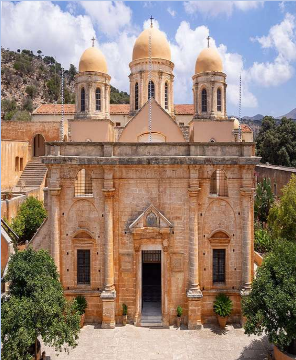
Η Μονή της Αγίας Τριάδας των Τζαγκαρόλων

Η Μονή της Αγίας Τριάδας των Τζαγκαρόλων βρίσκεται 15 χιλιόμετρα μακριά από την πόλη των Χανίων, στο Ακρωτήρι. Είναι ένα από τα πιο σημαντικά μοναστηριακά συγκροτήματα της Βενετοκρατίας στην Κρήτη, χτισμένο τον 17ο αιώνα από δύο Βενετούς αδελφούς μοναχούς. Το μοναστήρι κάηκε κατά την διάρκεια της Τουρκοκρατίας και γύρω στο 1830 ξεκίνησαν οι εργασίες ολοκλήρωσης του. Πρόκειται για ένα εντυπωσιακό μοναστήρι με την είσοδο να στέκει κάτω από το καμπαναριό.