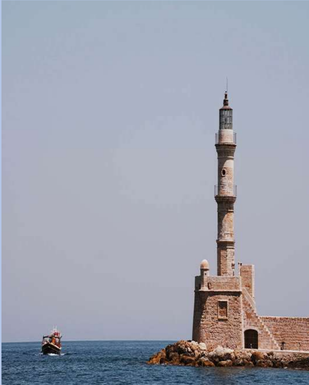
Ο Αιγυπτιακός Φάρος στο Ενετικό Λιμάνι Χανίων

Το Ενετικό Λιμάνι των Χανίων είναι ένα από τα πιο φωτογραφημένα σημεία της Κρήτης. Κατασκευάστηκε από τους Βενετούς τον 14ο αι. και από τότε αποτελεί το στολίδι της παλιάς πόλης. Εκεί δεσπόζει και ο διάσημος Φάρος Αιγυπτιακής κατασκευής που χρονολογείται από τον 19ο αι. και ο οποίος αντικατέστησε τον φάρο των Ενετών του 17ου αι. Επίσης, θα δείτε και τα Νεώρια που κατασκεύασαν οι Ενετοί τον 16ο αι.