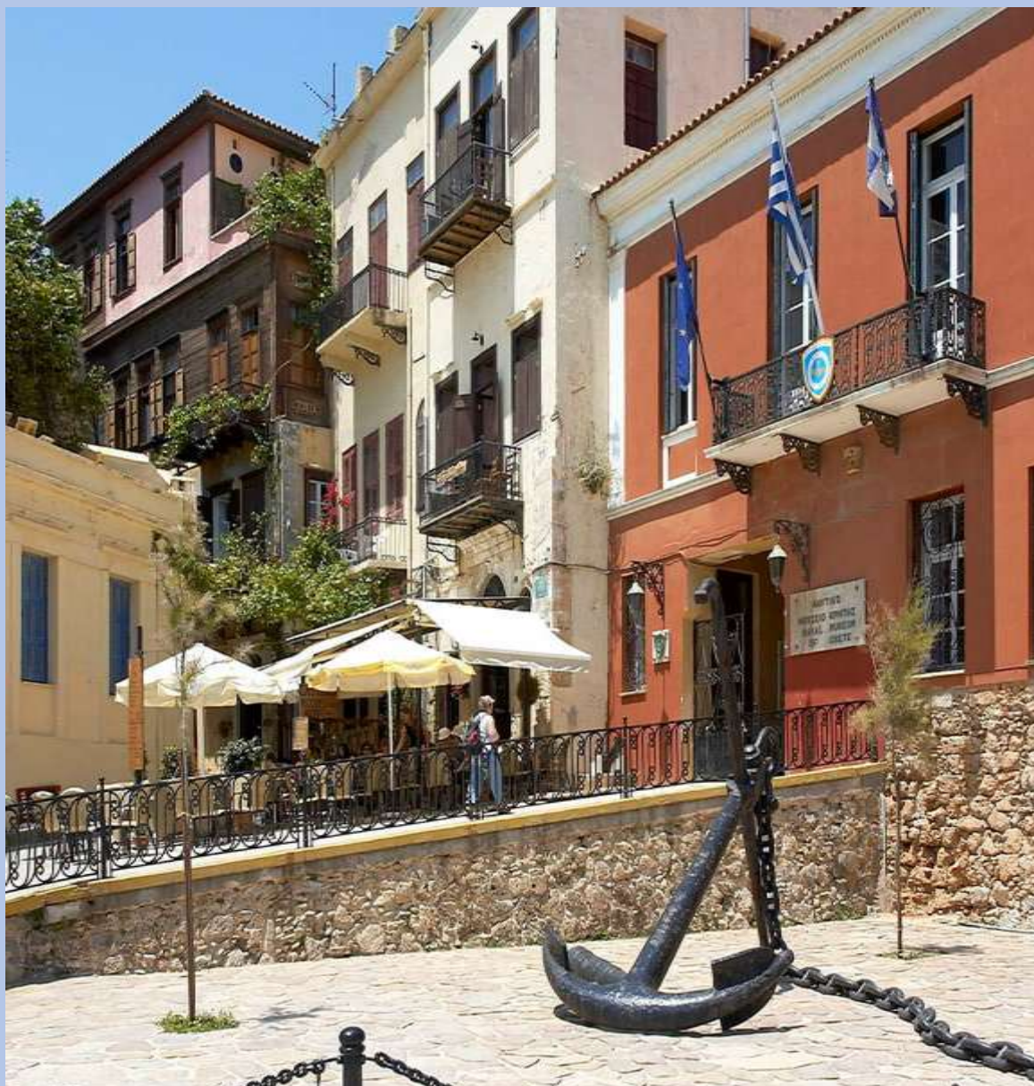
Ναυτικό Μουσείο Κρήτης στα Χανιά

Το Ναυτικό Μουσείο Κρήτης βρίσκεται στο Ενετικό λιμάνι των Χανίων, στην είσοδο του φρουρίου Φιρκά . Θα το αναγνωρίσετε αμέσως από την μεγάλη άγκυρα στον εξωτερικό του χώρο. Εκεί θα εμβαθύνετε στην ναυτική ιστορία του νησιού με μιας σειράς από λεπτομερείς εκθέσεις και πρόσβαση σε ένα από τα παλαιότερα ναυπηγεία, το Νεώριο Μορο .