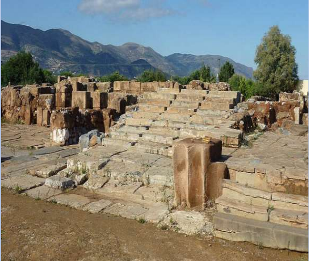
Το Μινωικό Ανάκτορο στα Μάλια

Ανατολικά του Ηρακλείου, στην περιοχή Μάλια βρίσκεται ένα παλάτι ενός ακόμη αδελφού του βασιλιά Μίνωα. Αναφέρεται ως το παλάτι του Σαρπηδόνα και είναι το τρίτο μεγαλύτερο μινωικό ανάκτορο στην Κρήτη. Φαίνεται να είναι εγκαταλελειμμένο από τα τέλη της δεύτερης χιλιετίας π.Χ. και περιείχε θέατρο, διπλές αυλές, βασιλικά διαμερίσματα κ.α. Η επίσκεψη στο ανάκτορο είναι μαγευτική.