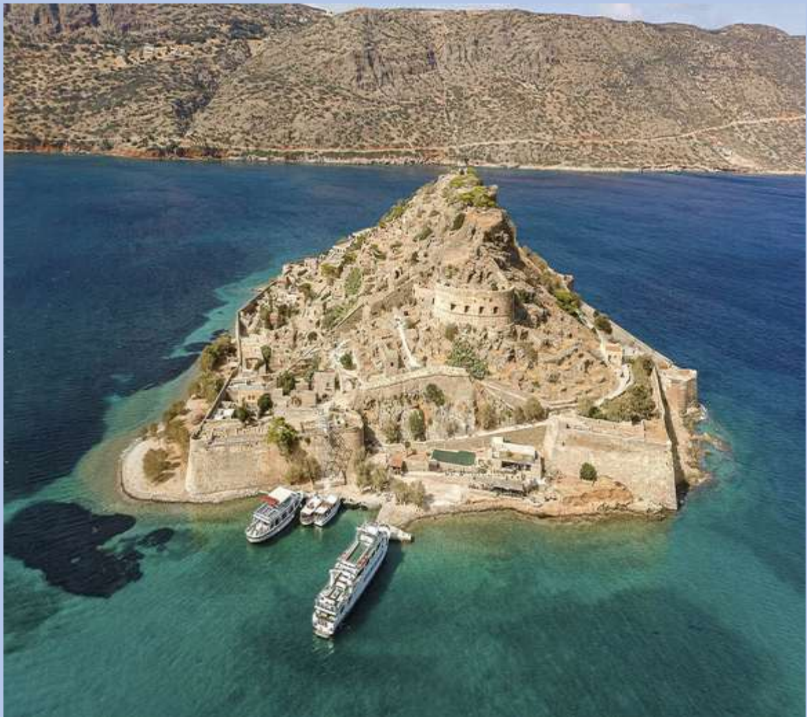
Το νησί της Σπιναλόγκας

Όλοι γνωρίζουμε το νησί της Σπιναλόγκας , το οποίο χρησιμοποιήθηκε ως καταφύγιο για τους λεπρούς μέχρι το 1957. Το νησί όμως είχε τραβήξει το ενδιαφέρον πολύ νωρίτερα και μάλιστα οι Ενετοί έχτισαν περίπου το 1579 ένα φρούριο (που σώζεται μέχρι σήμερα) πάνω στα ερείπια μιας αρχαίας ακρόπολης. Η Σπιναλόγκα είναι ένα από τα πιο δημοφιλή αρχαιολογικά τοπία της Κρήτης και μπορείτε να την επισκεφθείτε με καράβι από τον Άγιο Νικόλαο, την Ελούντα και την Πλάκα.