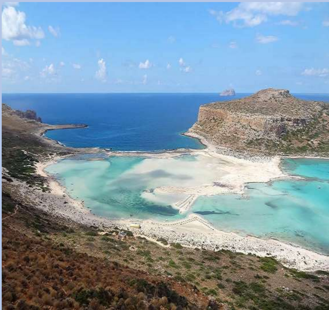
Η Λιμνοθάλασσα του Μπάλου στα Χανιά

Ο Μπάλος είναι επίσης μια μαγευτική παραλία στα Χανιά, από τις πιο εντυπωσιακές στον κόσμο. Πρόκειται για μια λιμνοθάλασσα, με καταγάλανα νερά και αμμώδη παραλία. Αν πάτε οδικώς στον Μπάλο, θα πρέπει να γνωρίζετε ότι ο δρόμος δεν είναι πολύ εύκολος και θα πρέπει να κατεβείτε σκαλιά για να φτάσετε στην παραλία. Εναλλακτικός τρόπος είναι να πάτε με καραβάκι από το λιμάνι της Κισσάμου , όπου θα σας μεταφέρει και στο νησάκι της Γραμβούσας .