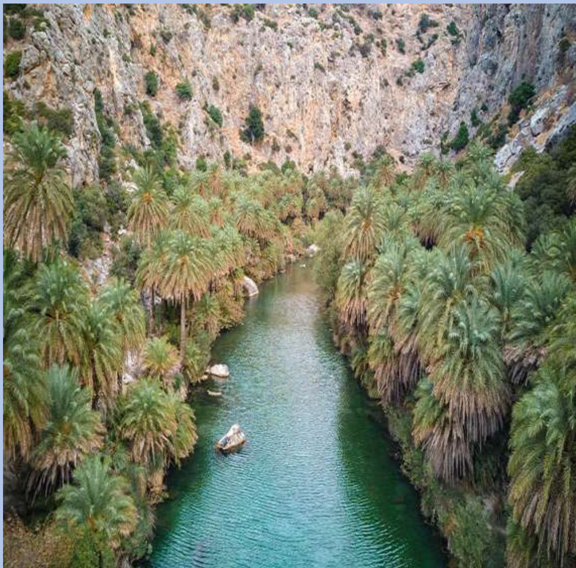
Το Φοινικόδασος της Πρέβελης στο Ρέθυμνο

Η Πρέβελι είναι μια παραλία στα νότια του Ρεθύμνου, στην οποία καταλήγει το Κουρταλιώτικο φαράγγι περνώντας από το Φοινικόδασος με τον παραπόταμό του. Είναι προστατευόμενη περιοχή από το δίκτυο Natura 2000 και είναι ένα από τα κορυφαία πράγματα που θα δείτε στην Κρήτη.