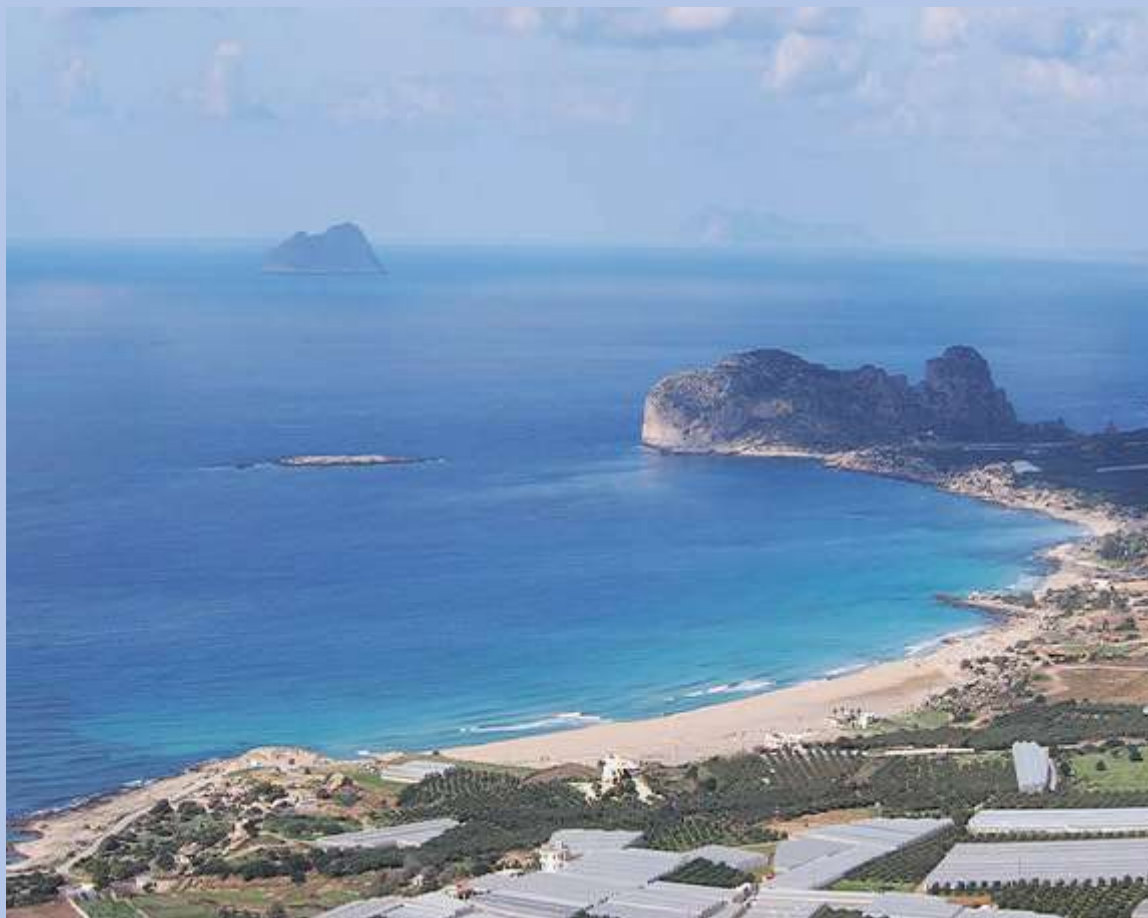
Η παραλία Φαλάσαρνα στα Χανιά

Τα Φαλάσαρνα είναι μια από τις πιο αγαπητές παραλίες στα Χανιά. Βρίσκονται στο δυτικό άκρο του νησιού και φημίζονται για το μαγευτικό ηλιοβασίλεμα , το οποίο κυριολεκτικά βουτάει μέσα στο νερό, αφού η παραλία βρίσκεται στην δυτική ακτή της Κρήτης. Είναι μια πανέμορφη παραλία, με καταγάλανα νερά και χρυσαφένια άμμο. Στα Φαλάσαρνα υπάρχουν beach bar όλων των ειδών, από χαλαρά με lounge μουσική, μέχρι πιο ζωντανά με δυνατή μουσική και ημερήσια πάρτι.