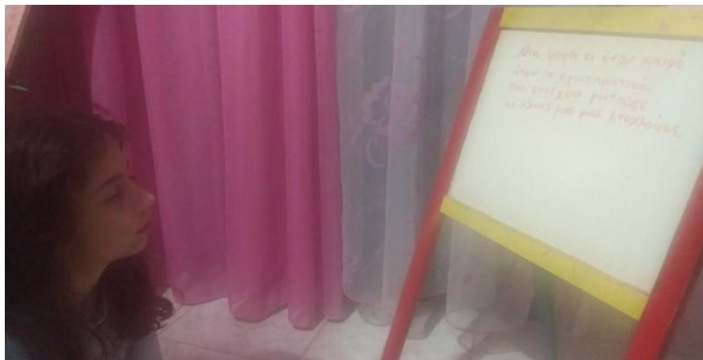
Εικονογράφηση και Φωτογραφία: Κρμινιώτη Αργυρώ