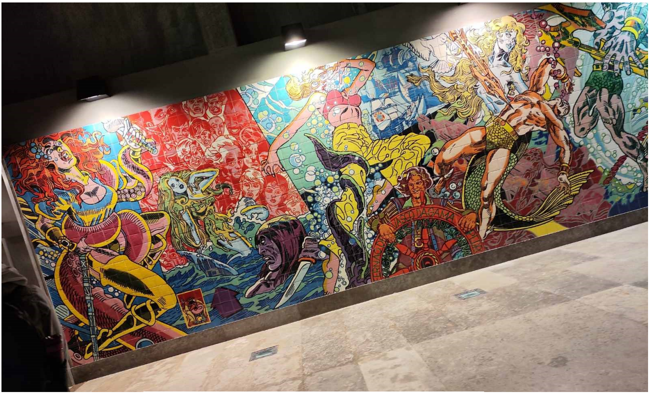
Τοιχογραφίες σε σταθμό του μετρό