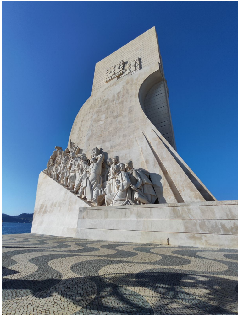
Το Μνημείο των Ανακαλύψεων, συνοικία Μπέλεμ