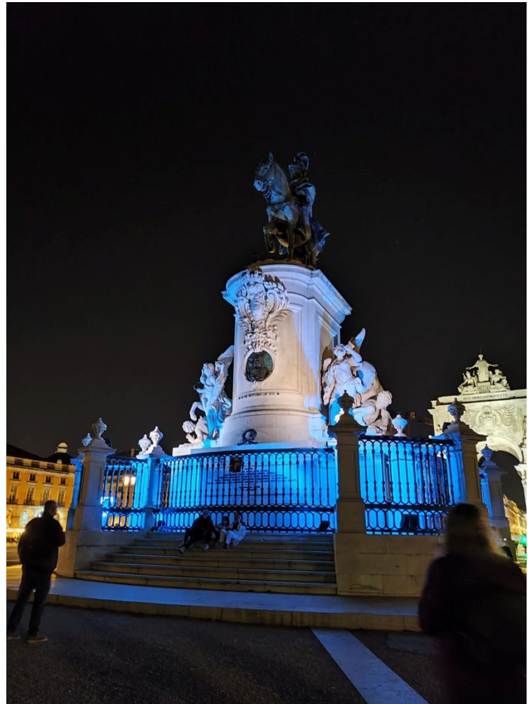
Monument to King José I, Praça do Comércio, Λισαβόνα