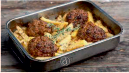
Αναγνώστης Μιχάλης-Ζαραβίγκα Αικατερίνη

ΧΕΙΜΩΝΑΣ σαρμάδια γαλοπούλα γεμιστή λάχανο πράσο κρέας βραστό κυδώνι ψητό κομπόστα με αποξηραμένα φρούτα ντολμαδάκια γιαλατζί