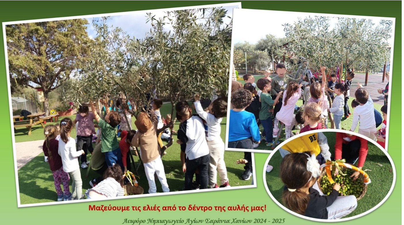
Μαζεύουμε τις ελιές από το δέντρο της αυλής μας!

Λειτουργία Νηπιαγωγείο Αγίων Σαράντα Χανίων 2024 - 2025