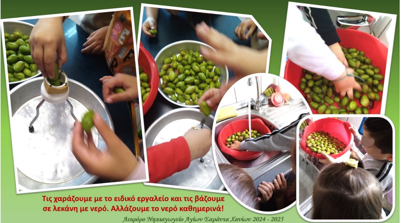
Τις χαράζουμε με το ειδικό εργαλείο και τις βάζουμε σε λεκάνη με νερό. Αλλάζουμε το νερό καθημερινά!

Αρχές του Νοέμβρη, εκμεταλλευτήκαμε τον καλό καιρό για να μαζέψουμε τις ελιές από το δέντρο της αυλής μας που έστεκε καταφορτωμένο! Και... δεν ήταν μικρή η σοδειά μας!