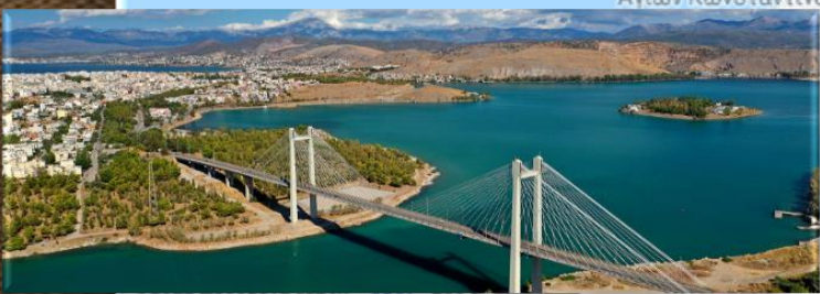
Η Υψηλή Γέφυρα