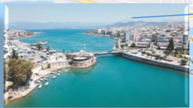
Η παλαιά Γέφυρα της Χαλκίδας