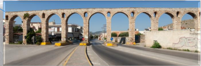
Το Ρωμαϊκό Υδραγωγείο (Καμάρες)