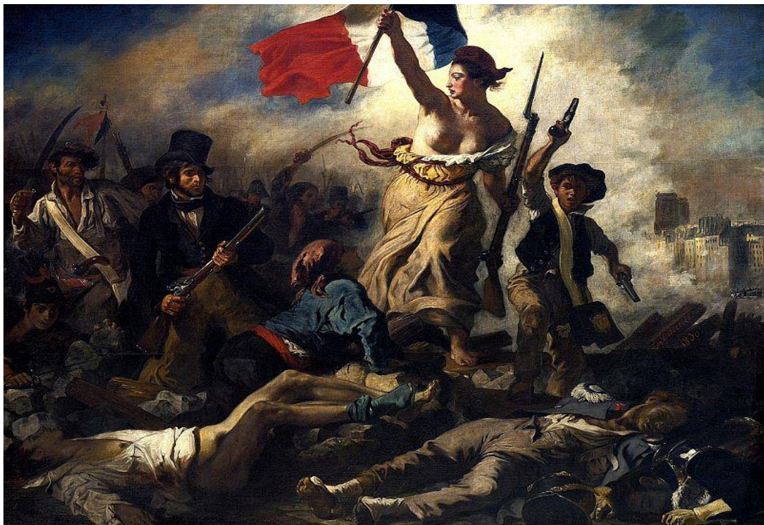
«Η Ελευθερία οδηγεί τον λαό» Ευγένιος Ντελακρουά

Αυτή είναι και η απεικόνιση της ελευθερίας στον πίνακα Η Ελευθερία οδηγεί το λαό του Eugène Delacroix το 1830. Παρόλο που ο πίνακας δεν αναφέρεται στην επανάσταση του 1789 αλλά σ' αυτή του Ιουλίου του 1830, η απεικόνιση είναι τόσο ισχυρή που ο πίνακας έγινε το σύμβολο όλων των Γαλλικών εξεγέρσεων για την ελευθερία.