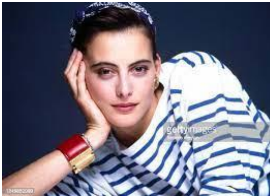
Inès de la Fressange