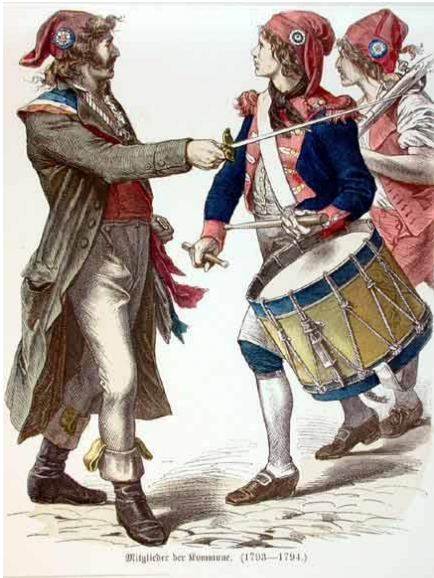
Mitglieder der Commune. (1793—1794.)